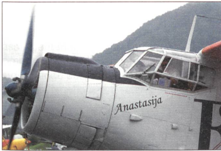
Mit dem weltgrössten einmotorigen Doppeldecker Antonov An-2 wurden Passagierflüge durchgeführt.