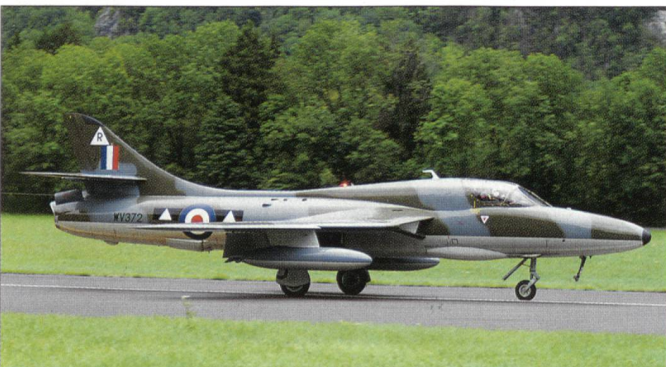
Dieser Hunter kam aus England nach Mollis zum Hunter-Meeting.