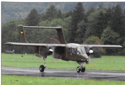
Das Flugzeug Bronco OV-10 flog früher bei der deutschen Luftwaffe.