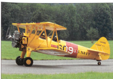
Die gut erhaltene Boeing Stearman rollt zum Start für die Vorführung.