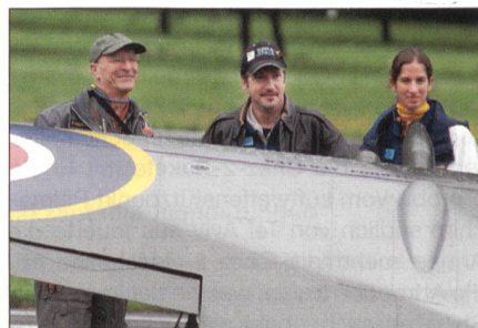
Der Astronaut und Hunter-Pilot Claude Nicollier (links) war in Mollis dabei.