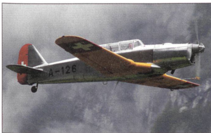
Die Pilatus P-2 war früher bei der Fliegertruppe im Einsatz.