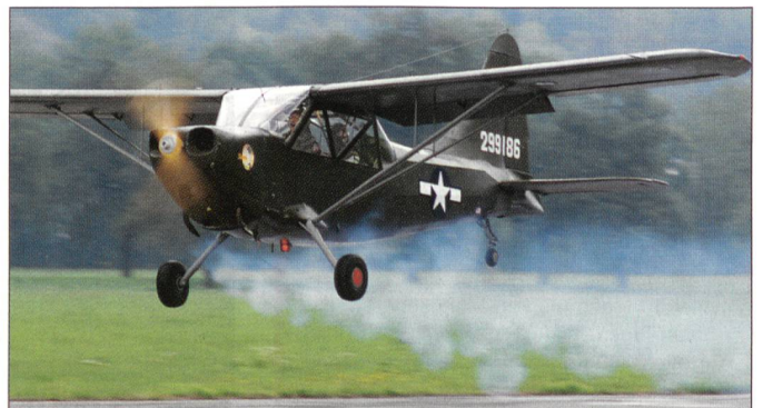
Fliegernostalgie mit Stinson L-5.