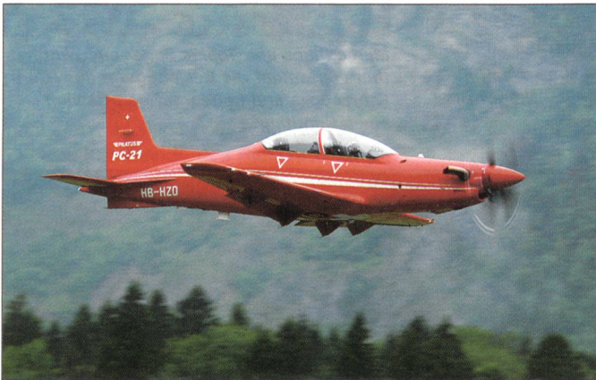
Pilatus zeigte ihr neues und modernes Schulflugzeug PC-21, welches die Luftwaffe beschaffen möchte.