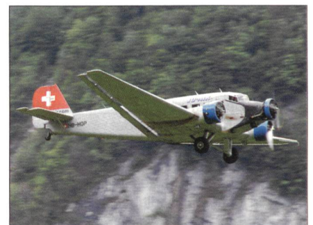
Die JU-52 war auf einem Rundflug unterwegs und besuchte die Airshow mit einem Überflug.