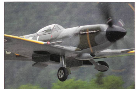
Die legendäre Spitfire beim Start im Glarnerland.