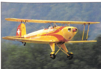
Der rüstige Doppeldecker Bucker-Jungmann bei der Vorführung.