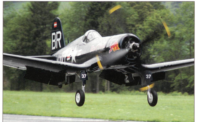
Die elegante und kraftvolle Corsair F4U bei der Landung anlässlich von Air Mollis.