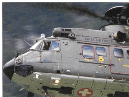
Die eindrucksvolle Vorführung des Cougar-Helikopters der Schweizer Luftwaffe begeisterte das Publikum.