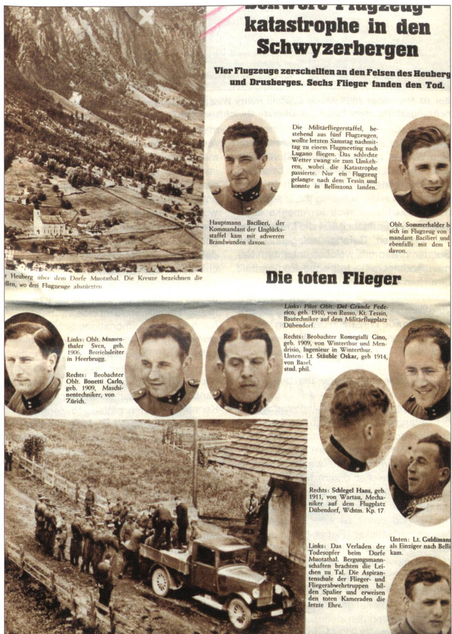
Die Schweizer Familie berichtete mit einer Seite über das grosse Unglück.