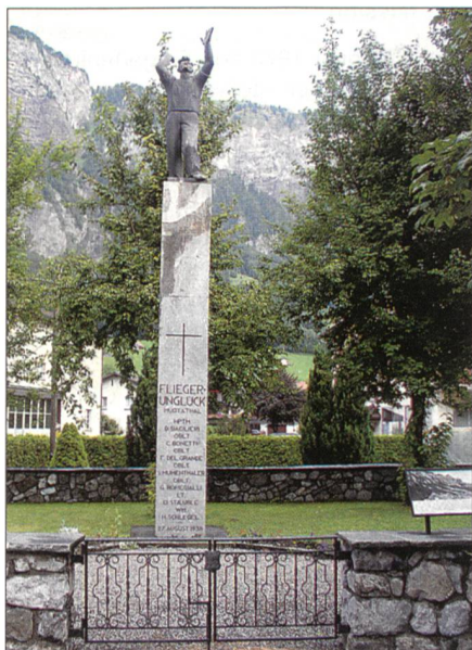
Noch heute erinnert mitten in Muotathal dieses Denkmal an das Unglück der Fliegerkompanie 10.