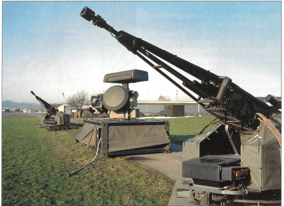
Das System Skyshield mit zwei Kanonen und dem Feuerleitgerät.

Während der jüngsten Auseinandersetzungen zwischen Israel und der Terrororganisation Hisbollah im Libanon wurde für alle sichtbar, dass selbst eine modernst ausgerüstete und ausgebildete Luftwaffe nicht