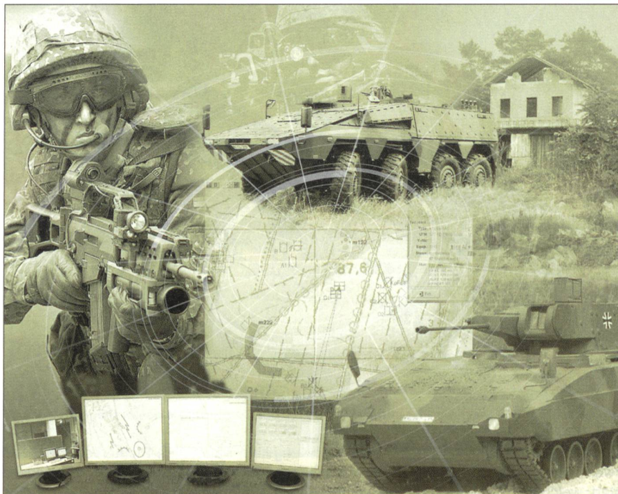
So wird sich der High-Tech-Infanterist der Zukunft auf dem Gefechtsfeld präsentieren.

Die aufgezeigten Fakten haben dazu geführt, dass in den eingangs genannten Ländern Entwicklungsprogramme mit dem Ziel gestartet worden sind, die Ausrüstung des Soldaten zu verbessern und auf die veränderten Verhältnisse auf dem Gefechtsfeld abzustimmen. Es geht darum, dem einzelnen Mann die neuen Technologien einfach verfügbar zu machen und ihm damit mehr Selbständigkeit innerhalb seines Verbandes zu ermöglichen. Schliesslich soll sein mitzuführendes Material leichter werden. Der typische amerikanische Füsilier schleppt heute rund 55 kg mit sich