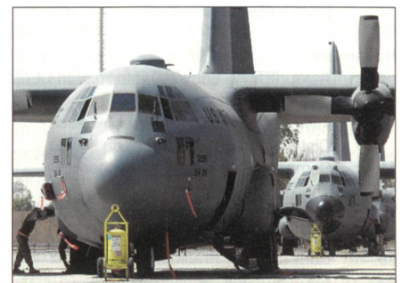
Die ausgedienten C-130-Flugzeuge werden ersetzt.

General Rick Hillier, der Chef des Verteidigungsstabes, erklärte dazu, dass er es besonders be-