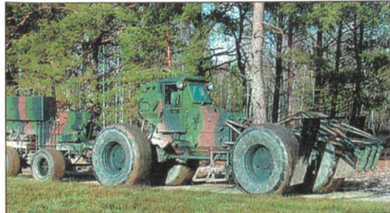
Minenräumsystem «Souvim 2»

MDBA hat die Entwicklung des Minenräumsystems «Souvim 2» abgeschlossen. Hauptaufgabe