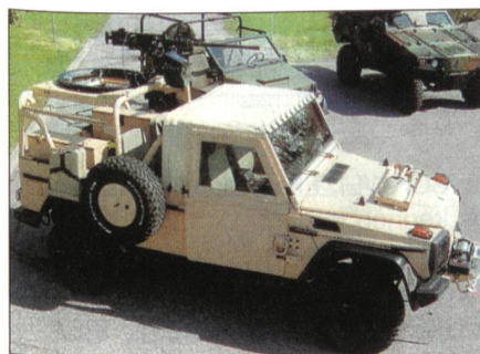
Neues Patrouillenfahrzeug der französischen Spezialeinheiten

Das Kommando für Spezialoperationen hat das erste der bestellten Spezialpatrouillenfahrzeuge erhalten. Hierbei handelt es sich um eine spezielle Variante des Daimler Chrysler G 270 CDI, welcher über eine Zuladung von 1100 Kilogramm und über ein Einsatzgewicht von rund 4 Tonnen verfügt. Dies in Verbindung mit den relativ kompakten Abmessungen ermöglicht es, zwei dieser Fahrzeuge in einem Transportflugzeug des Typs Transall zu transportieren. Das Fahrzeug verfügt über diverse Stauboxen sowie je eine