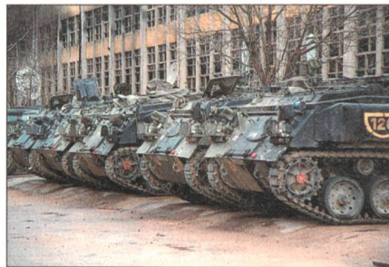
Fahrzeuge des Typs FV 432.

Alle Fahrzeuge erhalten einen neuen Motor, ein neues automatisches Getriebe und ein neues Kühlsystem. Damit wird das Fahrzeug schneller und antriebsfreudiger. Einige Fahrzeuge werden mit einem digitalen Fernmeldesystem, 124 je-