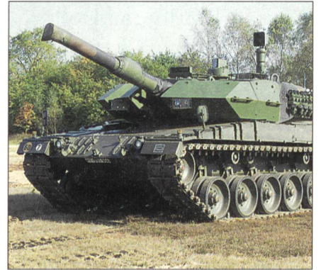
Die Warnsensorik kombiniert einen UV-Flugkörperwarnsensor und einen Laserwarner, die am Turm des Puma integriert werden.

Selbstschutzsystem ausrüsten, das Treffer durch gelenkte Panzerabwehrmunition verhindert. Das System besteht aus Warnsensoren, die anfliegende Flugkörper oder auf das eigene Fahrzeug gerichtete Laserstrahlung erkennen und dieses an den Zentralrechner melden. Dieser aktiviert elektronische oder pyrotechnische Gegenmassnahmen, die einen Treffer verhindern. Damit wird die Gefährdung in unübersichtlichen Szenarien bei internationalen Einsätzen verrin-