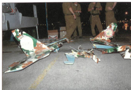
Wrack des abgeschossenen UAV «Ababil».

Die Ausrüstung der «Hisbollah-Miliz» mit UAVs, technisch hochwertigen Fluggeräten, unterstreicht erneut die moderne Bewaffnung der Hisbollah. Sie ist mit modernen Boden-Boden-Raketen mit Reichweiten bis zu 200 km, hoch entwickelten Panzerabwehr- und See-Ziel-