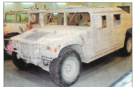
Humvee mit Minenschutz der Firma LMT Technologies

Die Panzerung trägt dabei der dünnen Aluminiumstruktur des Fahrzeugs Rechnung und soll sowohl leicht wie auch unauffällig sein. Es benutzt dabei ein neues Prinzip aus dünnen und widerstandsfähigen Platten, welche die Detonationsenergie auffangen, anstatt der bisher verwendeten Panzerungen, welche mit ihrer V-Form die Energie abzulenken versuchten. Um höchst-