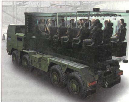
Der Container bietet Platz für 18 Personen. Mit Hilfe eines Hakenladesystems ist ein schnelles Auf- und Abladen auf das Transportfahrzeug möglich.

Das System integriert die Technik zur Einsatzführung, Kommunikation, Informationsgewinnung und -verteilung in derzeit 13 klimatisierten Containern. Der Gefechtsstand kann vollständig, aber auch in Modulen genutzt werden. Durch die Transportfähigkeit auf verschiedenste Transportmittel wird den heutigen Anforderungen an die Mobilität militärischer Systeme Rechnung getragen. P.J.