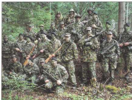
Nach langem und hartem Nachteinsatz sind am Morgen Verteidiger und Angreifer wieder vereint.

Eine gegnerische Kommandoeinheit ist im Raum Lauterbrunnen gelandet. Sie will versuchen, von dort aus in Richtung Interlaken vorzustoßen. Aufgabe der Verteidiger ist es, die Angreifer im