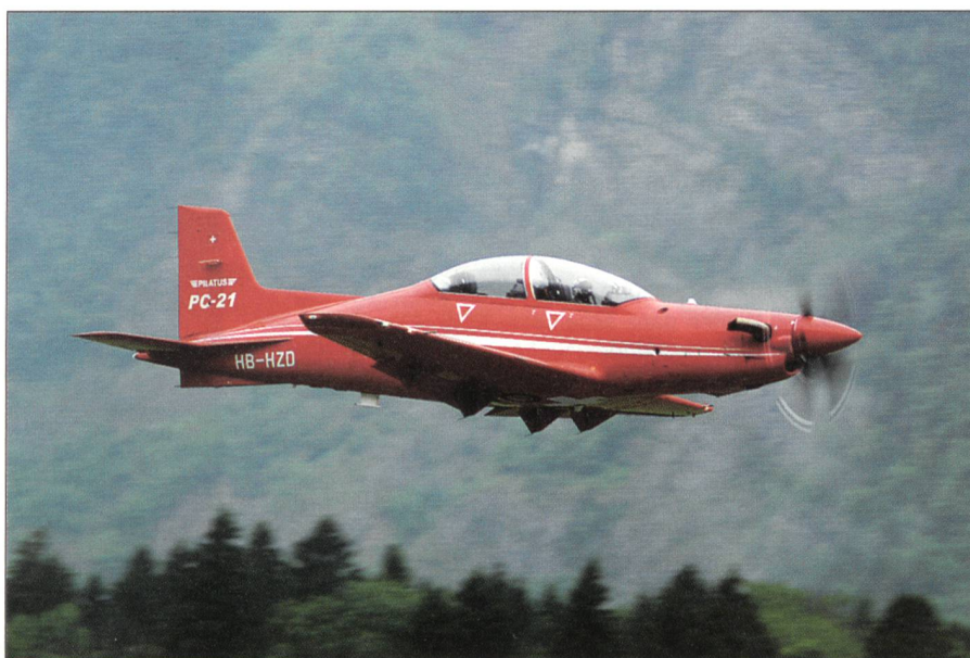
Der P-21 wäre direkt betroffen.

Ein bezeichnendes Beispiel: der jüngst erkorene italienische Staatspräsident, der sich jetzt entschuldigt für seinen seinerzeitigen Applaus zur Vergewaltigung des ungarischen Volkes, also 50 Jahre später. Es ist für die Unehrlichkeit der Politik im Westen bezeichnend, wie charakterliches und geistiges Versagen leicht verziehen wird... Zugegeben, diese Warnung vor den Armeeabschaffern der GSoA könnte gegenüber vernunftbegabten Zeitgenossen über-