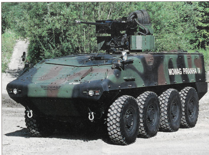
Die MOWAG muss den Piranha IV exportieren können ...

Beim Bau von Kampfflugzeugen oder Panzern werden Produkte der verschiedens-