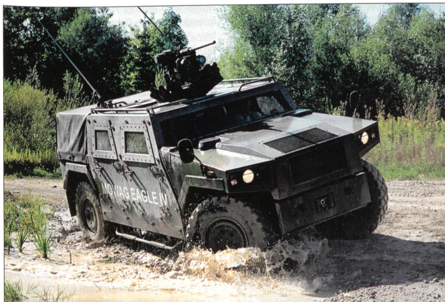
... und ebenso den Eagle IV.