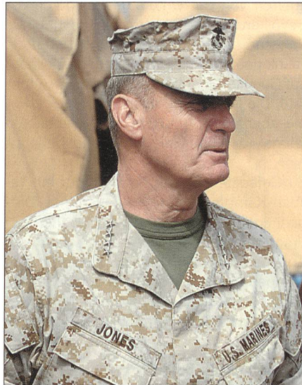
General James L. Jones, der Oberbefehlshaber (SACEUR) der Alliierten Truppen in Europa.

Neue Gefahren wie jene durch den radikalen Fundamentalismus, den internationalen Terrorismus, die Verbreitung von Mas-