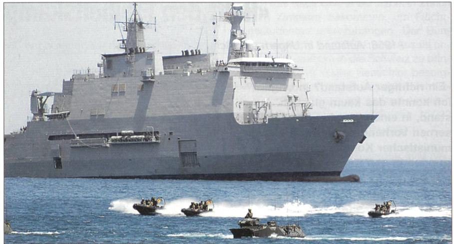
Die NATO demonstriert mit einer amphibischen Landeoperation ihre Einsatzbereitschaft.

Belgien, Bulgarien, Dänemark, Deutschland, Estland, Frankreich, Griechenland, Grossbritannien, Island, Italien, Kanada, Lettland, Litauen, Luxemburg, Niederlande, Norwegen, Polen, Portugal, Rumänien, Slowakei, Slowenien, Spanien, Tschechische Republik, Türkei, Ungarn, USA. Frankreich und Spanien sind militärisch integriert, Island besitzt keine Streitkräfte.