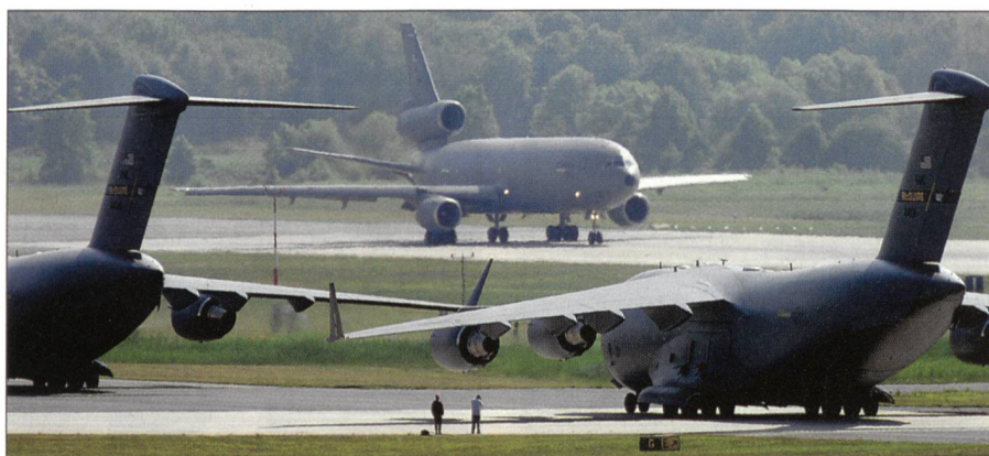
Nur die USA haben derzeit ausreichende strategische Transportmittel.

In Friedenszeiten unterstehen die Streitkräfte der Mitgliedsstaaten grösstenteils