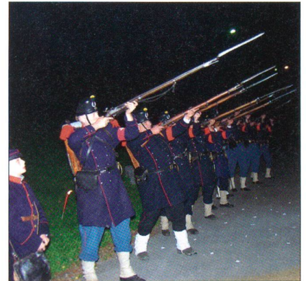
Gleich krachts: Die Compagnie 1861 schiesst einen Ehrensalt für angehende Commandos.

Es ist bereits dunkel und etwa 15 Grad. In acht Zehnergruppen marschieren die angehenden Commandos einer Drittklassstrasse entlang am Fusse des Alvier im Sarganserland. Vor mehreren Stunden sind sie etwa 15 km entfernt gestartet und absolvieren nun ihren Eintrittsmarsch. Vor einer Militärunterkunft, dem Ziel des Marsches, machen sich 10 Angehörige der Compagnie 1861 für den ersten Salutschuss bereit. Die erste Commando-Gruppe marschiert ein, sie stellt sich zum Melden auf.