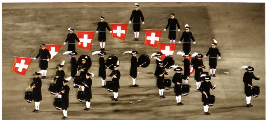
Schweizerfahne gleich siebenfach.