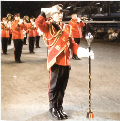
New Zealand Army Band.