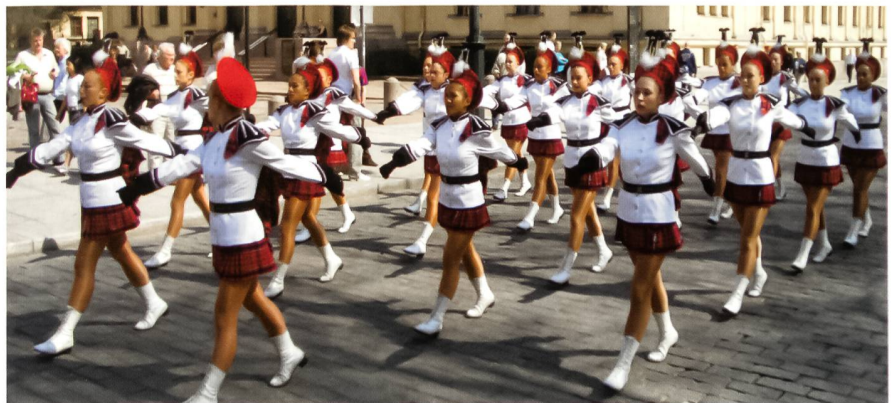
Lochiel Marching Team.