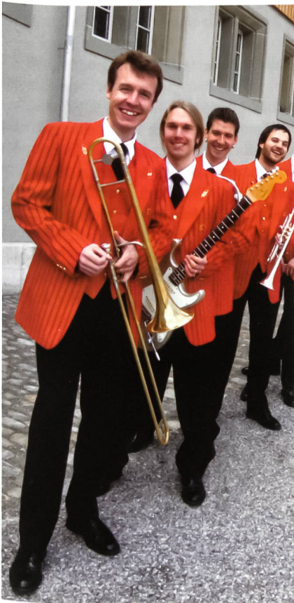
Swiss Army Gala Band.