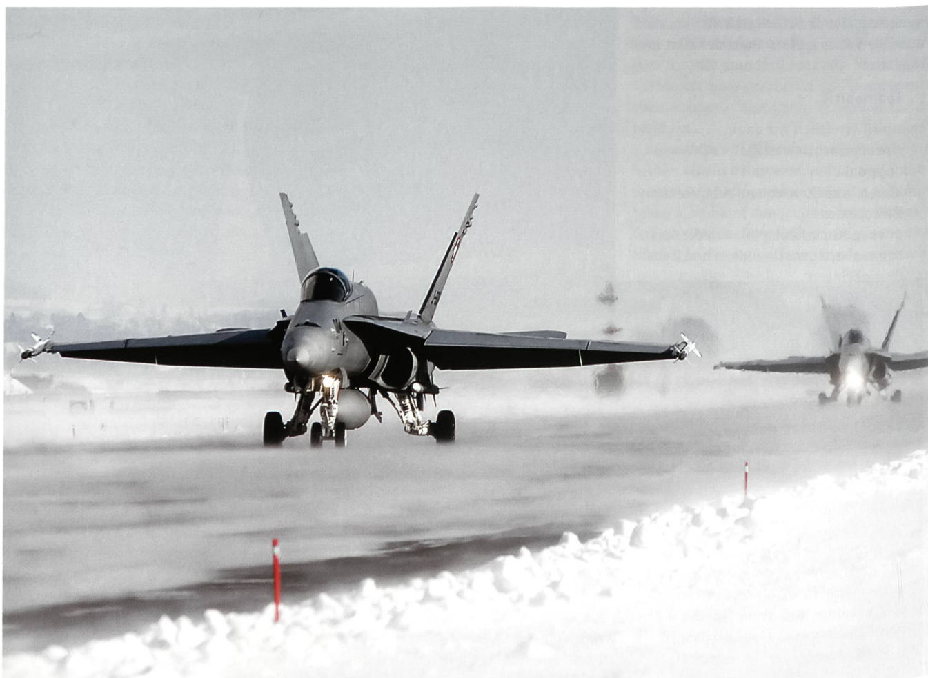
F/A-18 im WEF-Einsatz.

Zugegeben, die Arbeit als Referent Verteidigung beim Chef VBS hat nicht immer einen so direkten Bezug zu meinem Ursprungsmetier Luftverteidigung. Aber faszinierend und den Horizont erweiternd ist sie trotzdem in vielerlei Hinsicht.