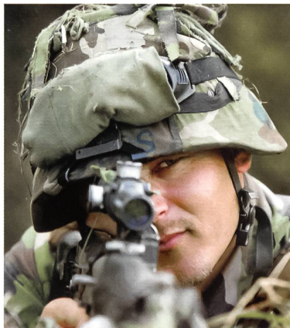
Verantwortung der Vorgesetzten für den Kämpfer an der Front.

Es gilt daher einfach einmal die Prämisse, dass diese moralische Anforderung an die Generalität – ohne Wenn und Aber – zu stellen ist. Die Generäle haben sich als Sicherheitsexperten den grundsätzlichen Fragen der Kriegsführung ihres Staates zu stellen und sich somit auch mit dessen Politik und dem damit verbundenen – leistungsfähigen oder verantwortungsbewussten – Einsatz der Streitkräfte auseinanderzusetzen.