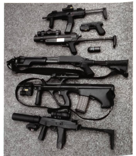
Mögliche Bewaffnung eines EKO-COBRA-Einsatzteams: HK MP7, Glock 17, MZP1 alias HK 69, Remington 870 Steyr AUG A2 und B&T MP9.