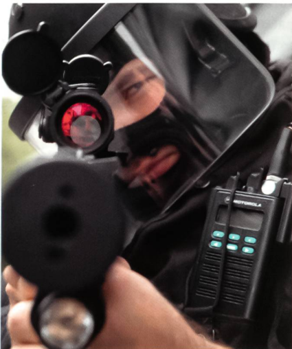
Blick ins gefährliche Ende einer MP9 mit Aimpoint-Military-Visier und Insight-Technology-Laser-Licht-Modul M6X.

Anders schon die Aufteilung bei den Einsatzkommandos Mitte, Süd und West. In Graz und Linz versehen dazu ins-