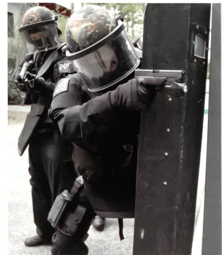
Das EKO COBRA übernimmt auch Antiterroraufgaben. Hier mit ballistischem Einsatzschild. Dahinter sichert ein Beamter mit einer Repetierschrotflinte.

Zu neuen Aufgaben zählt nun auch die Unterstützung der kriminalpolizeilichen Organisationseinheiten bei der Verhaftung gefährlicher Täter oder bei Zugriffen im Bereich der organisierten Kriminalität. Zwar konnte man dies auch schon vorher durchführen, aber nun wurde es zum alltäglichen Geschäft für die Profis von COBRA. Des Weiteren brachte die im Jahr 2002 durchgeführte Reform der Staatspolizei für COBRA weitere Aufgaben mit sich. Ihr wurden so zum Beispiel alle Personenschutzdienste in ganz Österreich übertragen. Zu den traditionellen Aufgaben gehören aber nach wie vor der Einsatz bei Geisel- und Amoklagen, die Erstürmung von Luftfahrzeugen, die