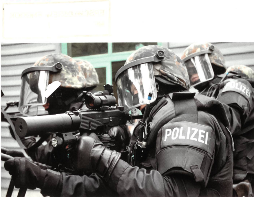
Einsatzformation des EKO COBRA mit der zu Versuchszwecken eingeführten Brügger & Thomet MP9 im Kaliber 9 mm x 19 mit Schalldämpfer und Aimpoint-Visier.

beamte aus ganz Österreich konnten sich nun zum Dienst bei COBRA bewerben. Tatsächlich hatte die Transformation von Lokalpolizei und Gendarmerie zu einer einheitlichen Polizeistruktur und zu erheblichen Verbesserungen geführt. Unter anderem soll ab jetzt theoretisch in 70 Minuten jeder Punkt in Österreich mit einem COBRA-Team erreicht werden können.