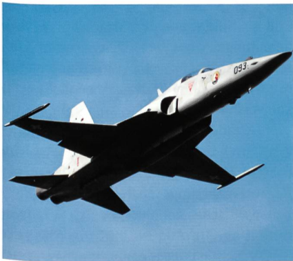
Payerne: Noch 11000 Flugbewegungen.

Parallel dazu haben die mit dem Lärm-schutz betrauten Dienststellen der Kantone Freiburg und Waadt eine Richtlinie für die Raumplanung erlassen. All dies wird sich