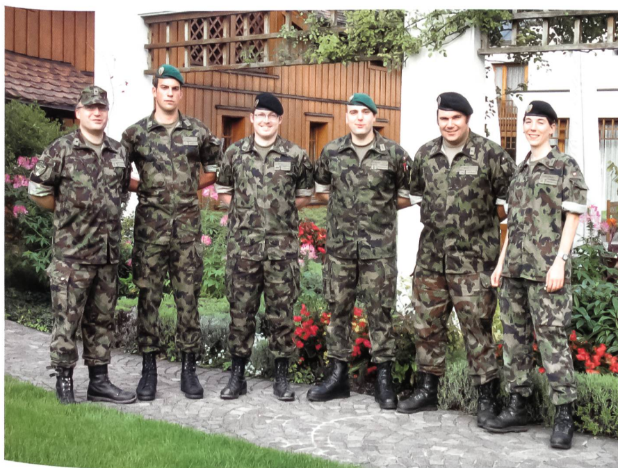
Das OK Schweizerische Unteroffizierstage 2010 im Lilienberg.

«Ich mache im UOV mit, weil ich hier immer wieder Neues über die Schweizer Armee lernen kann. Wir erhalten im UOV Einblick in andere Truppengattungen, können uns zwischen Uof und Of austauschen und pflegen eine gute Kameradschaft. Als besondere Highlights in unserem Vereinsleben betrachte ich die U Walenberg vom 9. Juni 2007, die Weiterentwicklungen unserer UOV-Übungen und das Mitmachen im Vorstand.»