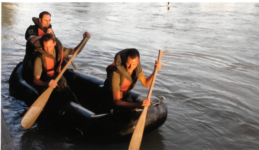
Spannender Wettkampf im Schlauchboot.

Dank der grossartigen Unterstützung der Verantwortlichen des Wpl Bremgarten konnte der SUOV seinen Wettkämpfern optimale Trainingsbedingungen vorgeben und auf gute Resultate zählen.