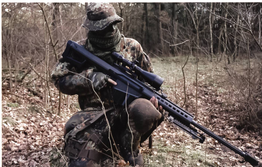
Das HK G82 im Kaliber .50 cal wurde bei der Infanterie der Bundeswehr eingeführt und gehört zum Rüstsatz «Infanterist der Zukunft» (IdZ).

Nur bei der Länderpolizei und beim Bundesgrenzschutz machte man sich ernsthafte Gedanken über ein polizeiliches Scharfschützenwesen und beschäftigte sich über lange Jahre hinweg mit Waffen, Technik und Einsatz dieser besonderen Art des Schiessens. Die Truppe wiederum sah den Höhepunkt des genauen Schiessens in einem wehrpflichtigen, urbanen Staatsbürger in