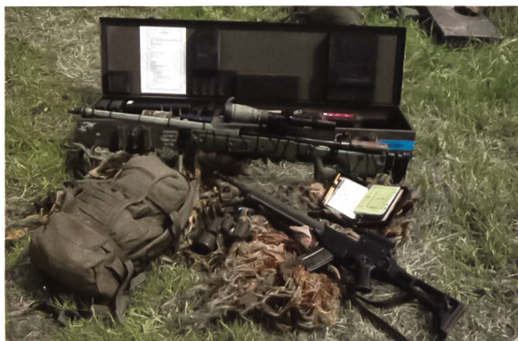
Ausstattung eines Scharfschützentrupps mit dem AI-AWF Scharfschützengewehr G22, Sniper-Book, dem Ghillie-Suit, Doppelfernrohr, HK G36 für den Beobachter und einem TT-Rucksack.

Heute sind bei der Infanterie (Jäger, Gebirgsjäger, Fallschirmjäger), der Luftwaffen- und Marinesicherungstruppe und den Panzergrenadiern fast alle Einsatzkompanien mit diesem Modell ausgestattet – und es erfreut sich grosser Beliebtheit. Die