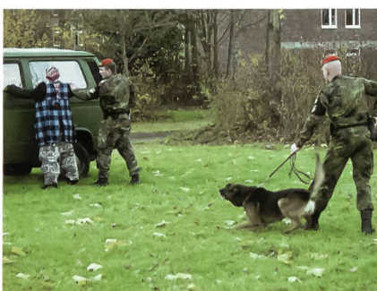
Der Täter ist gestellt, doch er reisst sich wieder los ...

Dienststelle der 2. Kompanie in Sigmaringen, schreibt er zum Vorfall die entsprechenden Berichte.