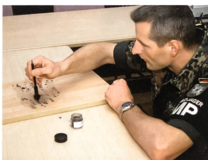
Hauptfeldwebel L. sichert am Tatort Spuren.

«Eine sehr gute Spur!», erklärt der Ermittler. Als Nächstes prüft Hauptfeldwebel L. den aufgebrochenen Schrank. Die Täter hatten leichtes Spiel: Mit einem Schraubenzieher wurde der Schrank aufgebrochen und die Kasse entwendet. Der erfahrene Ermittler macht Fotos vom Tatort. Befragungen vor Ort ergeben keine weiteren verwertbaren Erkenntnisse. Zurück auf seiner