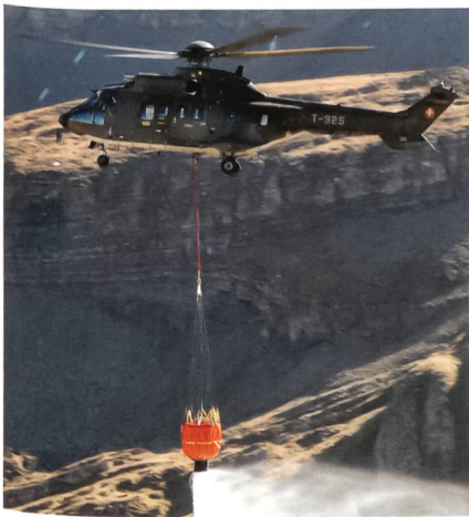
Löschdemonstration mit Super Puma.

F/A-18-Display-Pilot Hptm Thomas «Pipo» Peier demonstrierte mit einer eindrucklichen und gekonnten Vorführung die Leistungsfähigkeit des modernen Hornets. Den Abschluss bildete die Patrouille Suisse, mit einer exzellenten Vorführung, welche vor der herrlichen Bergkulisse über dem Brienersee besonders schön wirkte. +