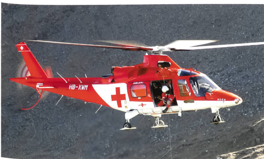
Rettungsdemonstration der Rettungsflugwacht.