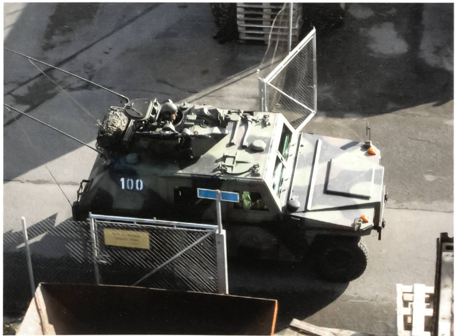
Miliz: Aufklärer riegeln Weiler ab.

Sind die Dienstpflichtigen erst einmal auf dem Kasernenhof versammelt, zeigt sich, dass auch viele von jenen, die sich nie