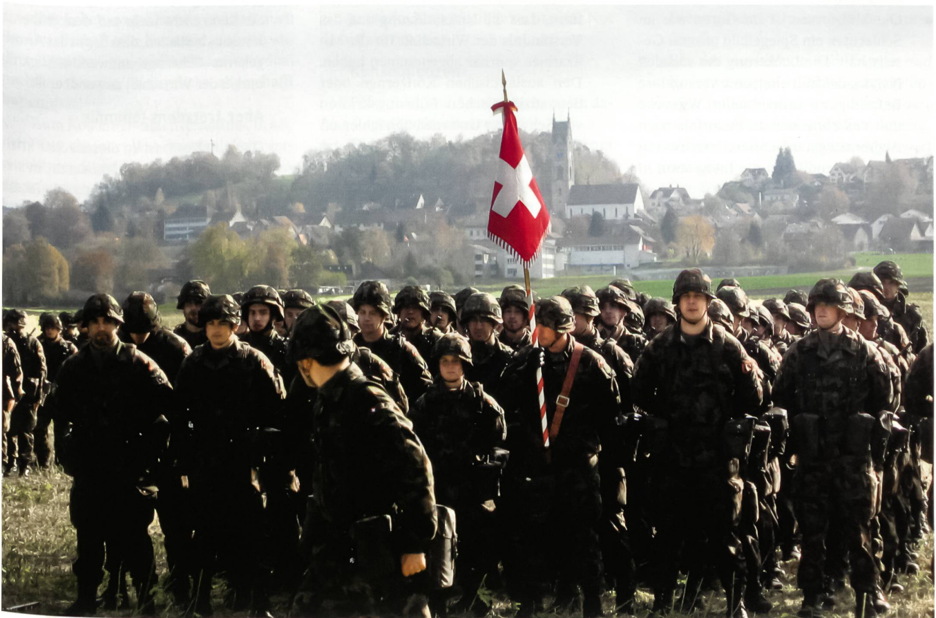
Miliz: Standartenabgabe Aufklärungsbataillon 4.