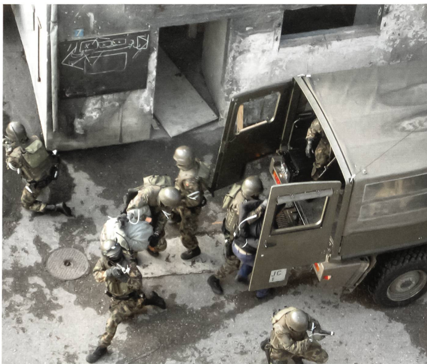
Miliz: Häuserkampf in Andelfingen.

eine Zwangsgemeinschaft, wie sie Armee und Wehrpflicht mit sich bringen.