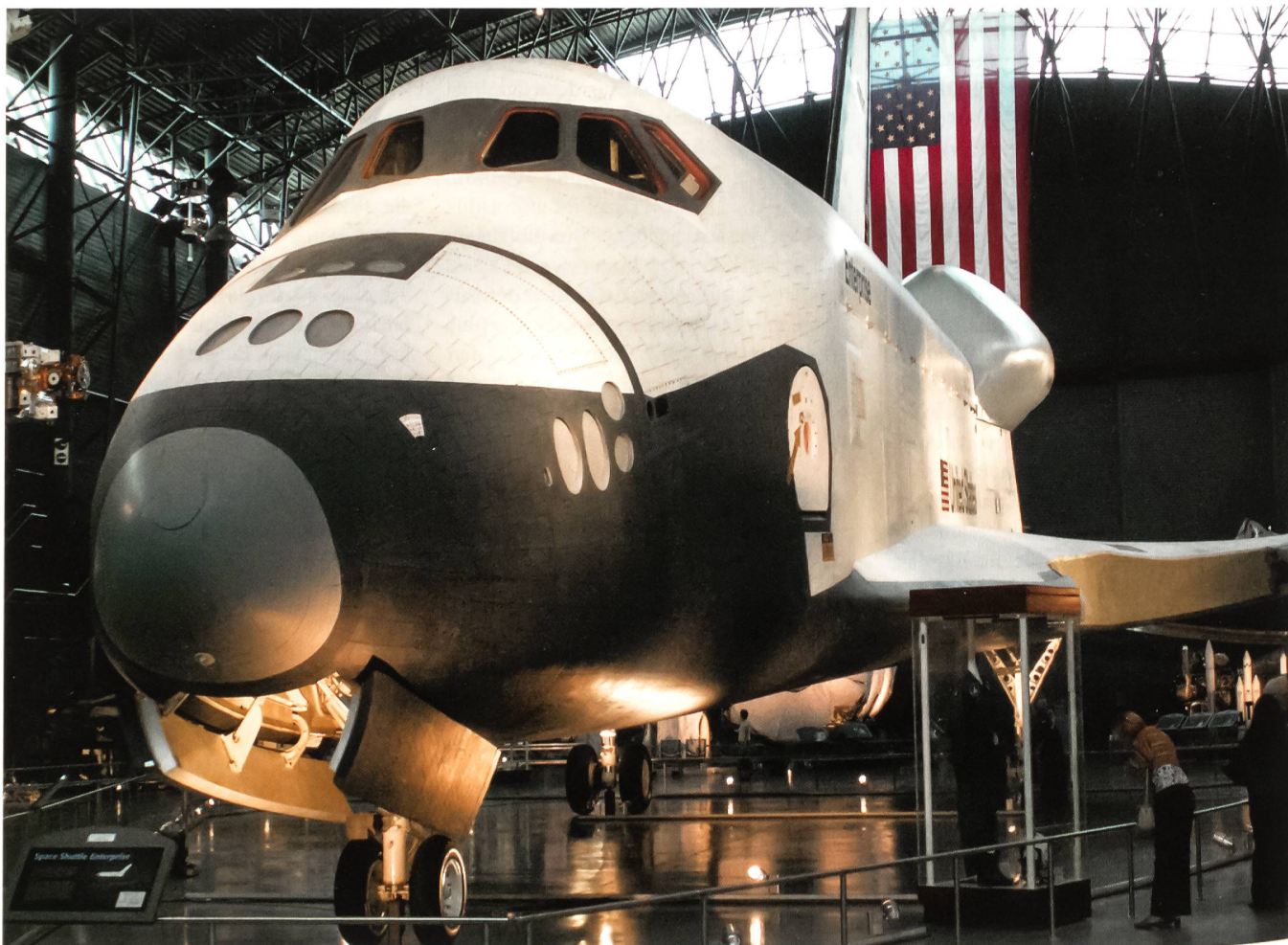
Das Space Shuttle «Enterprise» ist eines der spektakulärsten Ausstellungsobjekte und imponiert durch seine Grösse.

Das ursprüngliche Smithsonian-Luftfahrtmuseum im Zentrum von Washington