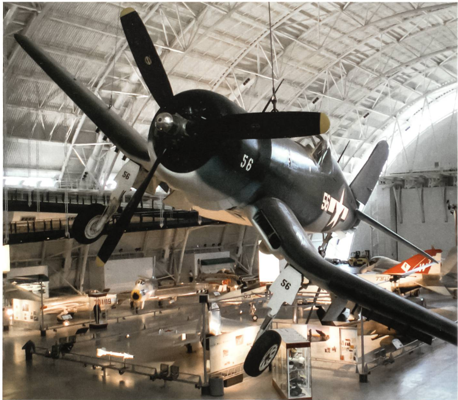
Über der riesigen Haupthalle des Udvar-Hazy-Luftfahrtmuseums hängt imposant ein Exemplar des berühmten Marine-Kampfflugzeuges Vought F4U-1D Corsair der US-Navy. Die Maschine war gegen Ende des 2. Weltkrieges mit der Fighter Squadron VF-10, später mit VF-89 geflogen. Das Ausstellungsstück trägt die Farben der Marine Fighter Squadron VMF-114.

Dazu fehlen derzeit etwa 92 Millionen Dollar, deren Sammlung noch Jahre dauern dürfte. Im dereinstigen Neubau wird eine besondere Attraktion die sein, dass Besucher den Restauratoren bei der Arbeit von einer Zuschauerbühne aus zusehen können. Nach Fertigstellung der zweiten Phase sollen in diesem Museum insgesamt 200 Flugzeuge und 130 Raumfahrt-Objekte