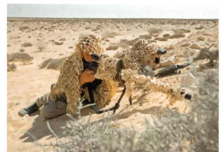
Niederländische Scharfschützen mit AI AWM.

Nach offiziellen Quellen scheint der britische Waffenhersteller «Accuracy International» (AI) mit seinem Modell «Arctic Warfare .338 Super Magnum» (AWM) die Ausschreibung für das sogenannte «next-generation sniper rifle» (Scharfschützengewehr der nächsten Generation) zu seinen Gunsten entscheiden zu können. Das aktuell eingesetzte Modell L96A1 desselben Herstellers im Kaliber 7,62 mm genügt den Ansprüchen der Truppe, insbesondere mit den gemachten Erfahrungen in Afghanistan und dem Irak in den Bereichen Feuerkraft und Reichweite, nicht mehr. Deshalb muss die neue Scharfschützenwaffe über das Kaliber 8,6 mm (.338 Lapua Magnum) verfügen, welches die effektive Einsatzdistanz von bisher 1000 m auf 1500 m er-