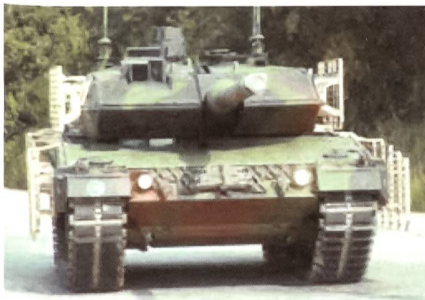
Leopard 2A6M CAN.

Krauss-Maffei-Wegmann übergab den kanadischen Streitkräften den ersten speziell umgerüsteten Kampfpanzer der Version Leopard 2A6M CAN, von welchen 20 Stück für den Einsatz in Afghanistan durch die kanadische Regierung geleast wurden. Beim Leopard 2A6M handelt es sich um die neueste und leistungsfähigste Version des Kampfpanzers, welche unter anderem über einen noch einmal verstärkten Minenschutz sowie