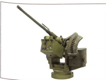
Trackfire RCWS mit schwerem MG.

Saab System hat mit dem neuvorgestellten Trackfire nun auch ein sehr konkurrenzfähiges Produkt im Bereich der fernbedienten Waffenstationen (RCWS). So verfügt das vollstabilisierte System über die Möglichkeit auch im Gelände während der Fahrt zu feuern und Ziele automatisch zu erfassen und gegebenenfalls entsprechend ihrer Bedrohung zu bekämpfen. Daneben kann das