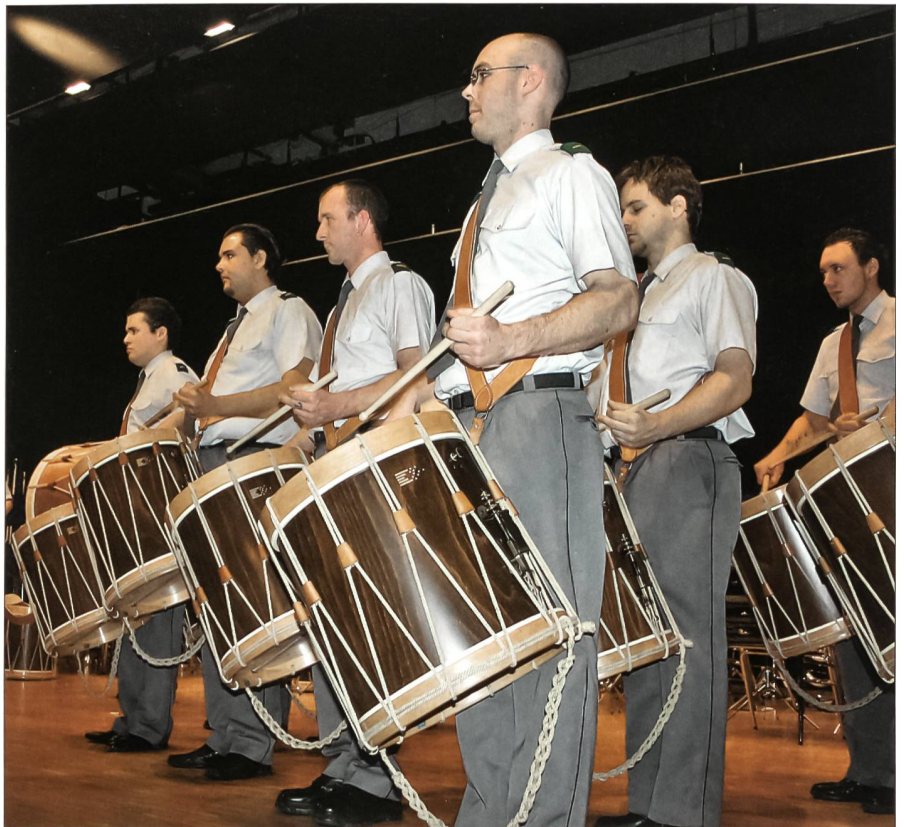
Die Tambouren glänzten auch mit einer Eigenkomposition.