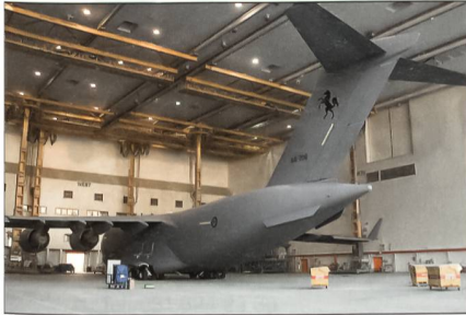
Die erste australische C-17.

Die Royal Australian Air Force (RAAF) wird vier strategische Lufttransporter C-17 Globemaster III (Block 17) erhalten. Die erste C-17-Transportmaschine für die RAAF absolvierte Ende Oktober ihren Jungfernflug und wurde am 28. No-