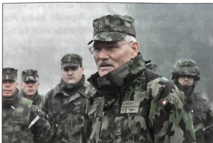
Der Chef der Armee im Dialog mit Rekruten.

Beim Besuch der Zugs-Arbeitsplätze wurde den Verbandsvertretern die moderne Infanterieausbildung gezeigt. Unter anderem wurden Schiessausbildung, Patientenreanimation, ABC-Aus-