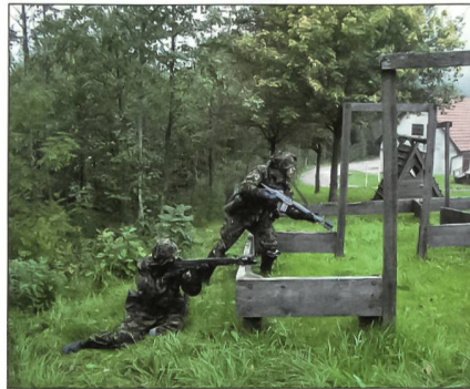
Üben am Modell: Häuserkampfgefecht erfordert eine hohe Präzision.

Bei Dämmerung wurden wir im Raum Hauenstein ausgesetzt, wo wir den Auftrag erhielten, ein Gebäude einzunehmen und zu halten. Nach einer problemlosen Säuberung des Hauses wurden wir einzeln vom Zugführer so positioniert, dass wir einen allfälligen Angriff abwehren könnten. Nach der erfolgreichen Abwehr eines Angriffes folgte eine Kurzbesprechung.