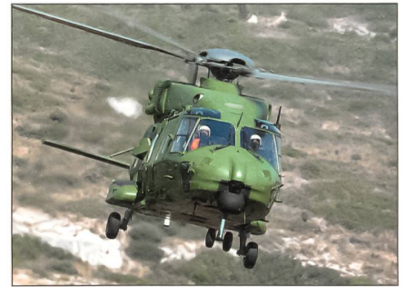
Auch für Griechenland: NH-90.

Die ersten Hubschrauber vom Typ NH-90 für die griechischen Streitkräfte stehen vor der Auslieferung. Insgesamt werden 20 NH-90-Helikopter zuzüglich 14 als Option für Griechenlands Heer gefertigt. Von den 20 Maschinen sind 16 in der Version als taktischer Sporthubschrauber und vier für Spezialeinsätze konfigurierte Helikopter