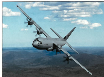
C-130 der USAF.

Seit mehr als 50 Jahren wird die Hercules produziert und ist damit ein Teil der grossen Flugzeuggeschichte geworden. Heute ist die C-130 Super