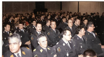
Offiziere der Ter Reg 4.