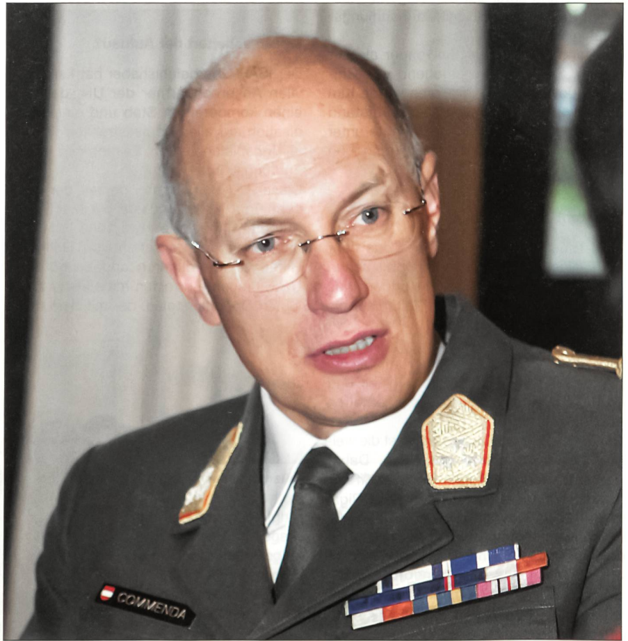
Generalleutnant Othmar Commenda: «Unser Projekt ist im Parlament breit abgestützt.»

Erreichen das Bundesheer und die Reformer um Commenda ihr Ziel bis im Jahr 2010? Commenda schaut über 2010 hinaus: «Wir erkannten früh, dass wir in Phasen vorgehen müssen. Wir arbeiten nach einem genauen Phasenplan. Das Jahr 2010 bildet in diesem Plan nur ein Zwi-