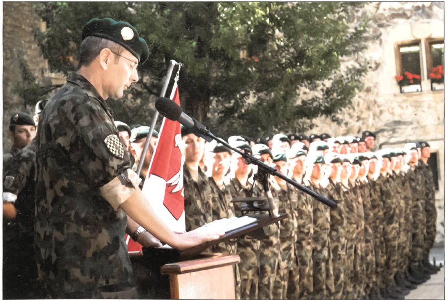
Berufsoffizier in würdiger Funktion.

und so eine nachhaltige Verbesserung zu erreichen und wieder Vertrauen herzustellen. Diese Gruppe funktioniert im Sinne eines «sounding boards» und wird im Wesentlichen durch Vertreter der Ausbildungsfront alimentiert. Die Zusammensetzung widerspiegelt eine Vielfalt der Truppengattungen, Berufskategorien, Funktionen und Grade. Das Konsultativorgan hat seine Arbeit zu Beginn dieses Jahres aufgenommen und wird sich regelmässig mit dem Chef der Armee zu einer Aussprache treffen. Für das militärische Personal dient das Intranet als Informationsplattform.