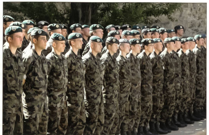
Das Ziel einer langen, strengen Ausbildung – die Brevetierung.

Geht man davon aus, dass die Freude an der Arbeit zu positiven Leistungen führt und die Arbeitszufriedenheit eine wesent-