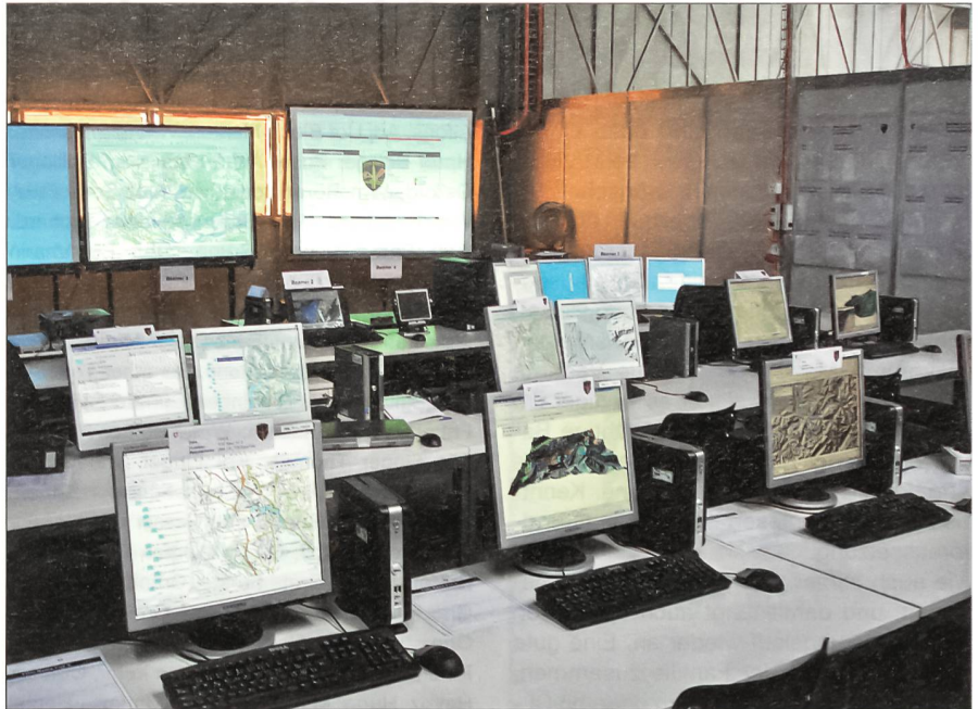
In Zukunft wird es im Kommandoposten eines grossen Verbandes aussehen wie in einem Handelsraum einer Bank: Es dominieren die Bildschirme.

Eine besondere Herausforderung bildet die Migration dieser teilweise schon vor-