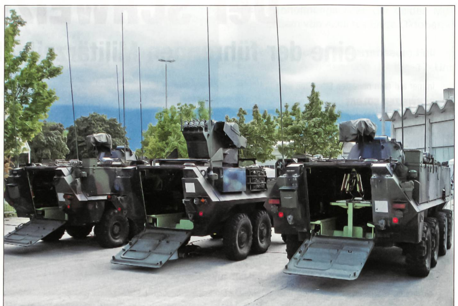
An den Antennen sind die Schützenpanzer FIS HE leicht zu erkennen.

Bis heute werden in unserer Armee Lagen, Befehle, Organigramme und Karten aller Art in der Regel auf Papier erstellt, vervielfältigt und verteilt. Letzteres kann