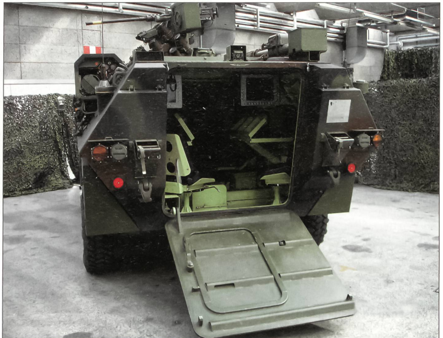
Ein Blick in das Innere eines Kommandofahrzeuges FIS HE zeigt die mit Computern ausgerüsteten Arbeitsplätze.

Für die Schweizer Armee, im Verbund mit anderen eidgenössischen, kantonalen und kommunalen Sicherheitsorganisationen, bedeutet dies, dass ein integriertes und krisenfestes Führungssystem notwendig ist. Es soll im Ernstfall eine aktuelle Lageanalyse sowie die zeitgerechte Anordnung und Kontrolle aller Massnahmen, die zur Aufrechterhaltung der inneren und äusseren Sicherheit notwendig sind, ermöglichen.