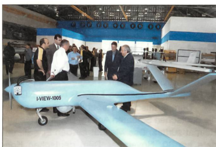
Taktisches UAV I-View-250.

Dieses UAV hat eine Flügelspannweite von 6,7 Metern und verfügt über ein vollautomatisches Start- und Landesystem. Mit seinem Katapultstarter kann es sogar von unebenen Flächen, die kleiner als ein Fussballfeld sind, starten. Das