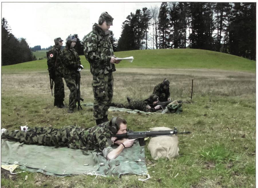
Präzise Arbeit im Gelände.

Redaktionsschluss für die jeweils übernächste Ausgabe der SUOV-Rubrik ist immer der Letzte des Monats. Beispiel: 28. Februar für die Ausgabe April 2007. Bitte alle Texte und Bilder per Mail (Adresse siehe Impressum) übermitteln. Bilder bitte in hoher Auflösung übermitteln. Spezielle Erscheinungstermine von Artikeln usw. bitte vorgängig absprechen. Die Spalte «UOV des Monats» steht jeder SUOV-Sektion offen. ah.