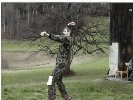
UWK-Werfen erfordert eine hohe Präzision.

Ostschweiz nehmen auch die Jugendlichen aus dem kleinen Weiler mit eigenem Schulhaus am Bachtel-Wettkampf teil. Der Geländelauf und die Wurfdisziplin werden durch die Jugendlichen mit Begeisterung absolviert. Die Mehrkämpfer messen sich in den Disziplinen UWK-Werfen, Präzisionsschiessen und Geländelauf. Beim Winterwettkampf ist eigentlich immer eine nordische Disziplin, also Langlauf, geplant. Doch um den Bachtel sind dieses Jahr nur grüne Wiesen zu sehen.