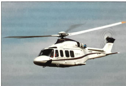
AW-139 von Agusta/Westland.

Das irische Air Corps hat Ende November zwei AW-139-Hubschrauber ausgeliefert erhalten. Der Agusta/Westland AW-139 ist ein mittlerer Transporthubschrauber mit zwei Antrieben. Er