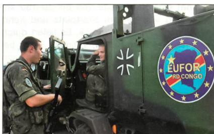
Soldaten bei der Mission.

Nach rund vier Monaten erfolgreichen Einsatzes im Rahmen der Mission EUFOR RD CONGO in der Demokratischen Republik Kongo kehrten die deutschen Soldaten Anfang Dezember in ihre Heimat zurück. Das Mandat für den Einsatz endete am 30. November. Dem deutschen Kontingent gehörten 500 Einsatz- und 280 Unter-