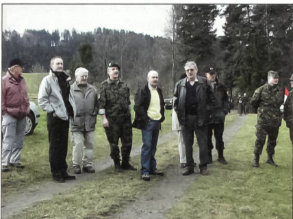
Lokal gut verankerter Wettkampf: Gemeindevertreter erweisen dem Winterwettkampf ihre Reverenz.

Seit vielen Jahren organisiert der Unteroffiziersverband Zürcher Oberland (UOV ZO) im Auftrag des Kantonalverbandes den Bachtel-Winterwettkampf. Die Veranstaltung zeichnet sich durch eine gute Organisation und eine familiäre Atmosphäre aus. Neben Mehrkämpfern aus der