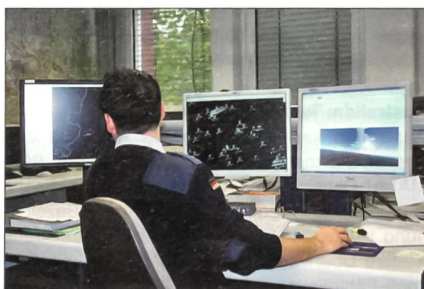
Arbeitsplatz in der Flugüberwachung.

Eurocontrol – eigentlich European Organisation for the Safety of Air Navigation – wurde 1963 gegründet und hat Mitglieder aus derzeit 37