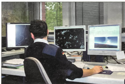
Arbeitsplatz in der Flugüberwachung.

Eurocontrol – eigentlich European Organisation for the Safety of Air Navigation – wurde 1963 gegründet und hat Mitglieder aus derzeit 37