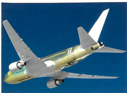
KC-767-Tankflugzeug für Japan.

Die japanischen Selbstverteidigungskräfte erhalten 4 Stück KC-767-Tankflugzeuge von Boeing geliefert. KC-767 für Japan ist ein militärisches Derivat der bewährten zivilen 767-200-Version von Boeing und hat gegenüber dem Konkurrenten, dem Airbus A-310, den Vorzug erhalten. Das Flugzeug wurde mit dem modernen Luftbetankungssystem RARO-II ausgestattet. Die Konfiguration sieht das auswechselbare Fracht-System vor, wonach Pas-