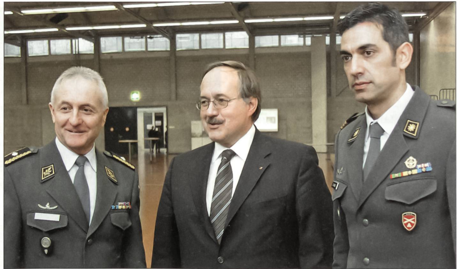
Brigadier Hans-Peter Wüthrich durfte an seinem Rapport Bundesrat Schmid begrüßen. Rechts Oberst i Gst Ennio Scioli, Referent Verteidigung im VBS.

Die Armee muss in den heutigen modernen Bedrohungsfeldern wie Terrorismus, terroristische Bedrohung oder den Auswirkungen der Proliferation erfolgreich sein. Bundesrat Schmid warb für den Entwicklungsschritt 08/11. Mit der geplanten Aufstockung von 16 auf 20 Infanteriebataillone wird ermöglicht, dass permanent während eines Jahres ein solches im WK