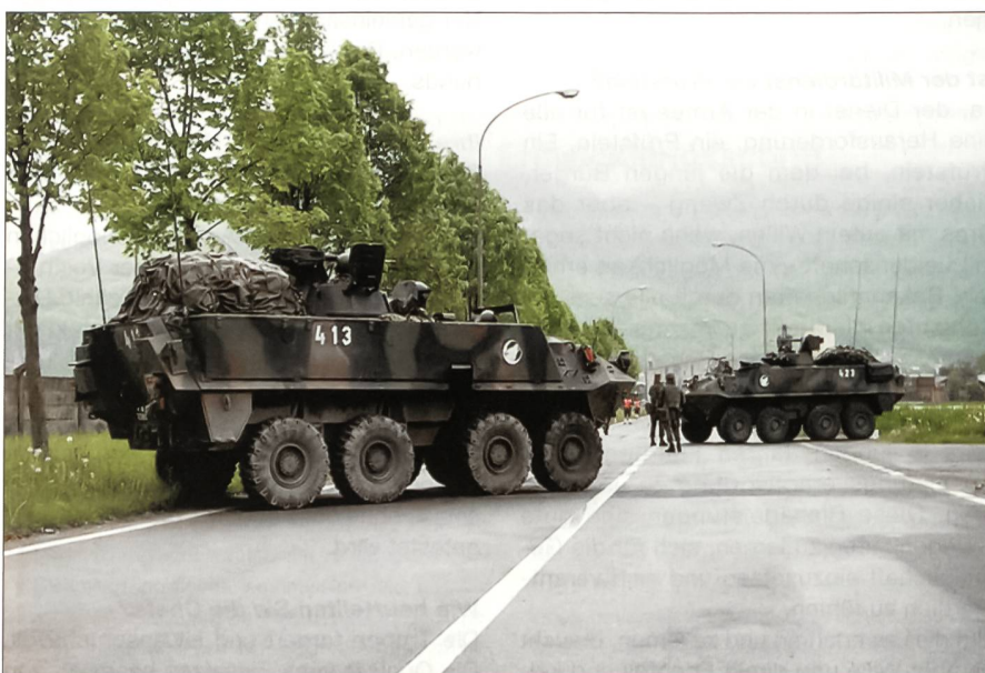
Radschützenpanzer in Collombey VS.

Mit dieser Frage beschäftigen sich Heerscharen von hochintelligenten Profes-