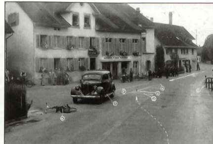
Die Strassen, der Strassenverkehr und seine Auswirkungen bildeten schon früh ein Kerngeschäft der Polizei. Das erste organisierte Polizeikorps war eigentlich die französische Maréchaussée, die nichts anderes zu tun hatte, als die Strassen zu sichern. Dies ist in abgewandelter Form heute noch so. Im Bild: Polizeiliche Verkehrsunfallaufnahme in der ersten Hälfte des vorigen Jahrhunderts.