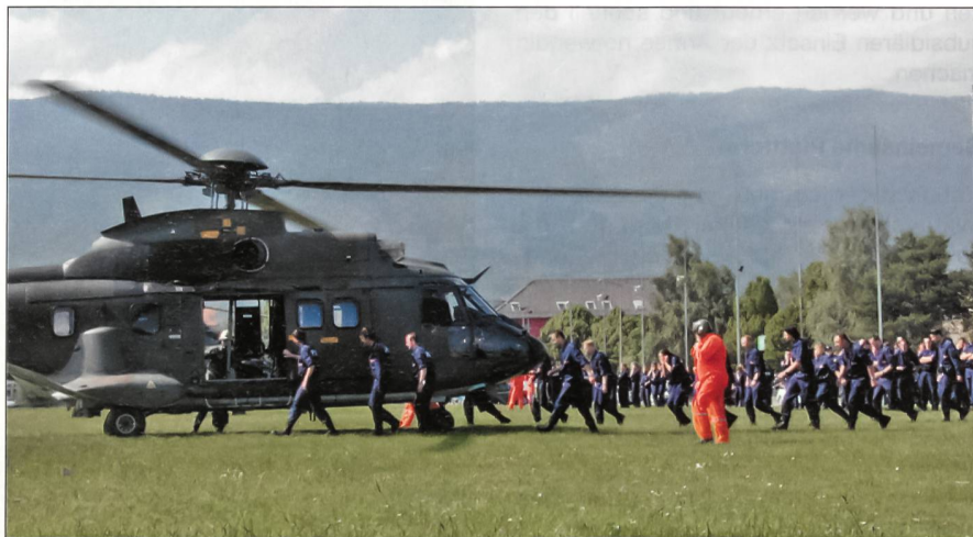
IKAPOL-Einsatz anlässlich des G8: Ein Polizeibataillon beim Verladen in Super Pumas der Schweizer Armee.

Zum Vernetzen gehört der Aufbau eines modernen chiffrierten Sprech- und Datenfunksystems Polycom, woran neben dem Grenz-