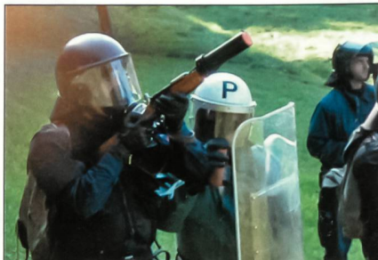
Die Schweizer Polizeikorps zeichnen sich durch einen anerkannt hohen Praxisbezug aus. Im Bild trainieren Spezialformationen den Weitschuss mit Reizgas-Geschossen. Die meisten Polizistinnen und Polizisten sind Mehrfachfunktionäre, d.h. neben ihrer Alltagsarbeit nehmen sie Zusatzfunktionen wahr. Dies garantiert ein hohes Mass an vernetztem Denken und ist auch ökonomisch sinnvoll.

Das Buch kostet 29 Franken und ist erhältlich beim Verlag des Schweizerischen Polizei-Instituts unter www.institut-police.ch/Verlag/leh .