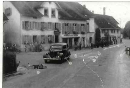
Die Strassen, der Strassenverkehr und seine Auswirkungen bildeten schon früh ein Kerngeschäft der Polizei. Das erste organisierte Polizeikorps war eigentlich die französische Maréchaussée, die nichts anderes zu tun hatte, als die Strassen zu sichern. Dies ist in abgewandelter Form heute noch so. Im Bild: Polizeiliche Verkehrsunfallaufnahme in der ersten Hälfte des vorigen Jahrhunderts.