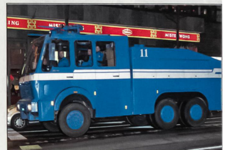
Einsatzbereit in Zürich: Die Stadtpolizei Zürich hatte im Hinblick auf allfällige Aktionen militanter WEF-Gegner ein Dispositiv erstellt. Der Wasserwerfer kam aber nicht zum Einsatz.

Entsprechend hoch war die Schadensbilanz mit mehreren zehntausend Franken. Rund 30 bis 50 verummte Personen verhielten sich höchst militant und begingen auf der ganzen Route massive Sachbeschädigungen wie Farbschmierereien und schlugen diverse Scheiben ein. Drei Polizisten wurden verletzt, neun Personen verhaftet, wie die Basler Polizei in ihrem Communiqué weiter schreibt. In Davos selber wurden die Kundgebungen ruhig abgehalten. ah.