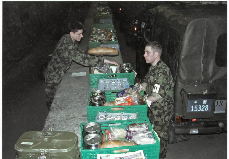
Eine letzte Kontrolle vor der Abfahrt: Jeder Aussenposten erhält seine Portion für einen Tag.

Der Richtstrahlpionier-Unteroffizier sitzt in einer Baracke vor dem Laptop und überprüft die Pegelkontrolle der Signale. Draussen pfeift ein eisiger Wind, etwas Schnee fällt. «Wir stellen hier mit sechs Mann einen 24-Stunden-Betrieb sicher!», sagt er. «Mit den aufgebauten Richtstrahlanlagen verbinden wir rund um die Uhr