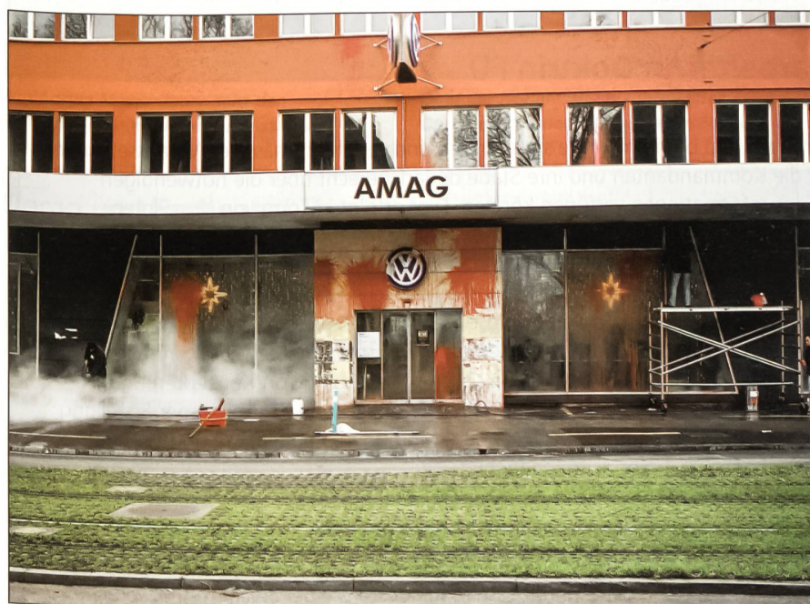
Sinnloser Farbanschlag im Vorfeld des WEF. Eine Reinigungsquiepe säubert Trottoir und Fassade des AMAG-Gebäudes in Zürich.

Im Rahmen des Assistenzdienst-Einsatzes gelangten in Davos selbst mit wenigen Ausnahmen nur die Profisoldaten der Militärischen Sicherheit für Personenschutz und Zutrittskontrollen zum Einsatz. Aus-