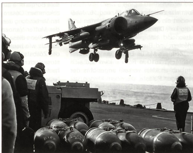
Eine Sea Harrier der No 801 Squadron, bewaffnet mit Sidewinder Luft-Luft-Lenk- waffen, Zusatztanks und Bomben, hebt vom Deck der HMS Invincible ab.