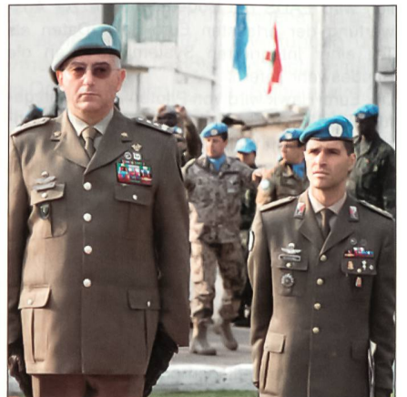
Generalmajor Claudio Graziano aus Italien.

In einer seiner letzten Verwendungen führte Graziano von Juli 2005 bis Februar 2006 die multinationale Brigade in Kabul, die ein Teil der von