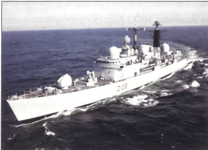
Zerstörer des Typs 42.

Bei der Royal Navy der britischen Streitkräfte werden intensive Überlegungen angestellt, um Einsparungen zu erzielen. Die mittelfristigen Einsätze im Irak und in Afghanistan verschlingen für