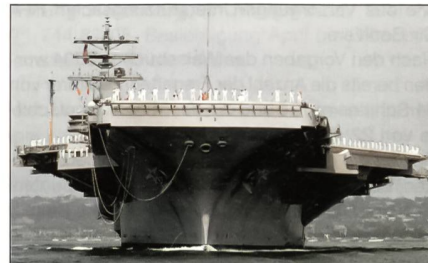
Projektionsstreitkräfte: Träger USS Ronald Reagan.

In Riga wurden auch Prioritäten für neue Befähigungen der nächsten 15 Jahre gesetzt. Eine Analyse hat für die überschaubare Zukunft ergeben, dass die grundsätzlichen Bedrohungen für die Allianz Terrorismus und die Weiterverbreitung von Massenvernichtungswaffen ebenso wie regionale Krisen, nichtregierbare Staaten, Missbrauch neuer Technologien und die Unterbrechung des Flusses lebensnotwendiger Ressourcen sind. Um