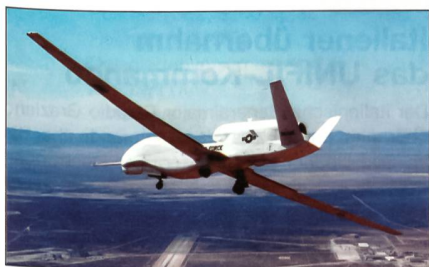
Global-Hawk der US Air Force.

Der Euro-Hawk basiert auf dem amerikanischen Basismodell Global-Hawk-RQ-4-Block 20, das von Northrop Grumman hergestellt und von der US Air Force bereits eingesetzt wird. Im Vergleich zu diesem bereits im US-Einsatz befindlichen unbemannten Aufklärer unterscheidet sich der Euro-Hawk durch seine neue Missionsausrüstung mit einem neuen, von EADS entwickelten Signalaufklärungssystem (Signal Intelligence – SIGINT), das Funk- und