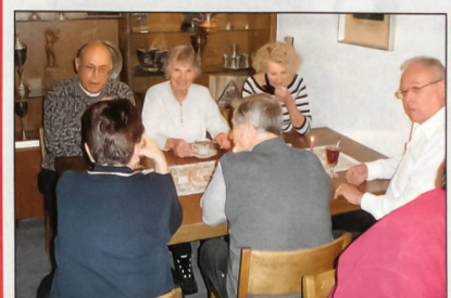
Gemütliche Runde im vereinseigenen Lokal «Stallwache».