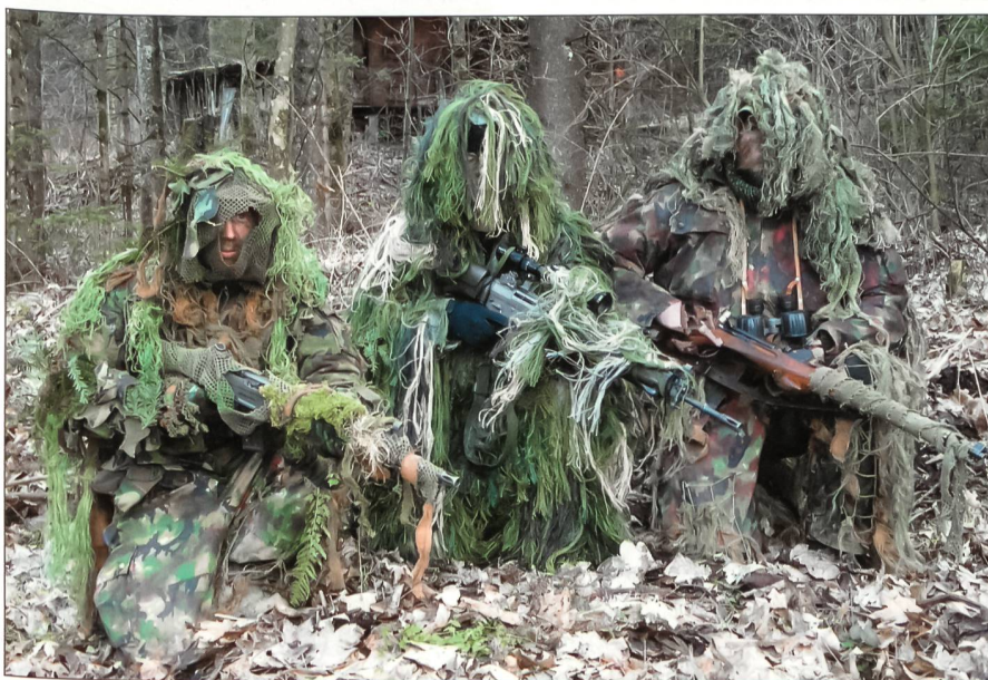
Drei Mitglieder des UOV Interlaken haben sich der Umgebung angepasst.

Wenn auch aus der Übung, wetterbedingt, keine Winterübung wurde, hinterliess doch der wie immer tadellos organisierte Anlass bei allen Teilnehmern einen sehr guten Eindruck. Wie es im UOV Interlaken Brauch und Sitte ist, wurde die Übung im Vereinslokal Hotel Hirschen in