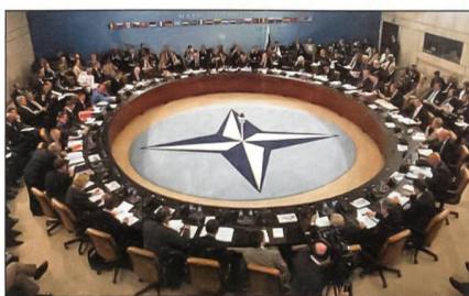
Sitzung des NATO-Rates.

Bei dem NATO-Gipfeltreffen Ende November in Riga erklärten die Chefs der Staaten und Regierungen, dass die Allianz beabsichtige, weitere Einladungen zur Mitgliedschaft auszusprechen. Dies gelte für jene Länder, die die NATO-Standards bis zum nächsten Gipfeltreffen 2008 erreichen werden.