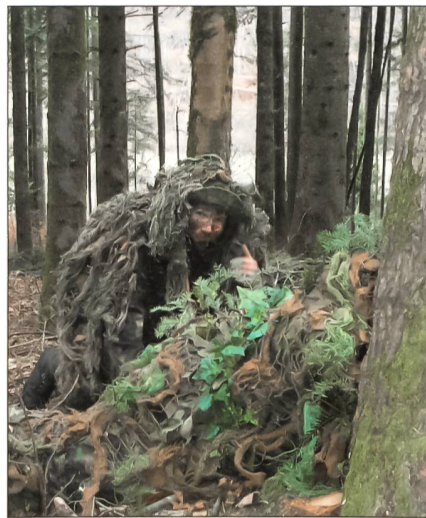
Beim Tarnen wird nichts dem Zufall überlassen.

arbeit hatten mehrere Übungsteilnehmer ihre Tarnanzüge selbst genäht. Andere wiederum versuchten mit Improvisieren die beste Tarnung für sich und die Waffe zu finden. Als zusätzliche Hilfe wurde an die Teilnehmer zum Thema «Tar-