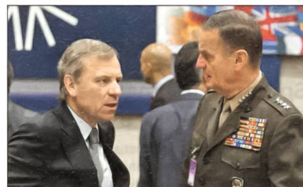
NATO-Generalsekretär Jaap de Hoop Scheffer (links).

Die NRF arbeitet auf Rotationsbasis: Nach Vorbereitung auf nationaler Ebene wird ein sechs Mona-