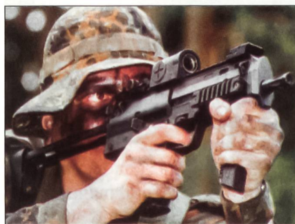
H&K MP7 im Kaliber 4.6 x 30 mm.

Das deutsche Verteidigungsministerium plant im Rahmen des Programms «Infanterist der Zukunft» eine grössere Bestellung beim Waffenhersteller Heckler&Koch. Dabei sollen die Infanterie sowie Schutzverbände der Luftwaffe und