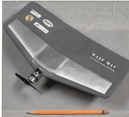
Wasp Micro Air Vehicle.

ASSIST (Advanced Soldier Sensor Information System and Technology), ein fortschrittliches Soldaten-Sensor-Informationssystem und -Technologie, ist ein anderes Werkzeug, das spezielle