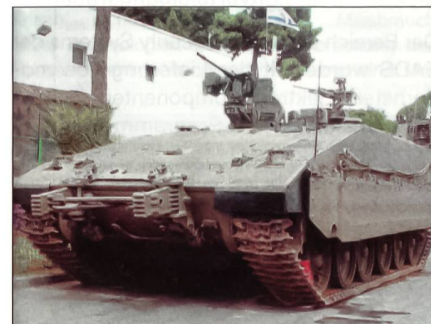
Gepanzertes Truppentransporter «Namer»

Der Namer soll neben einer ferngesteuerten Waffenstation des Typs Rafael Katlanit, welche mit einem 12.7-mm-Maschinengewehr oder anderen schweren Infanteriewaffen bestückt