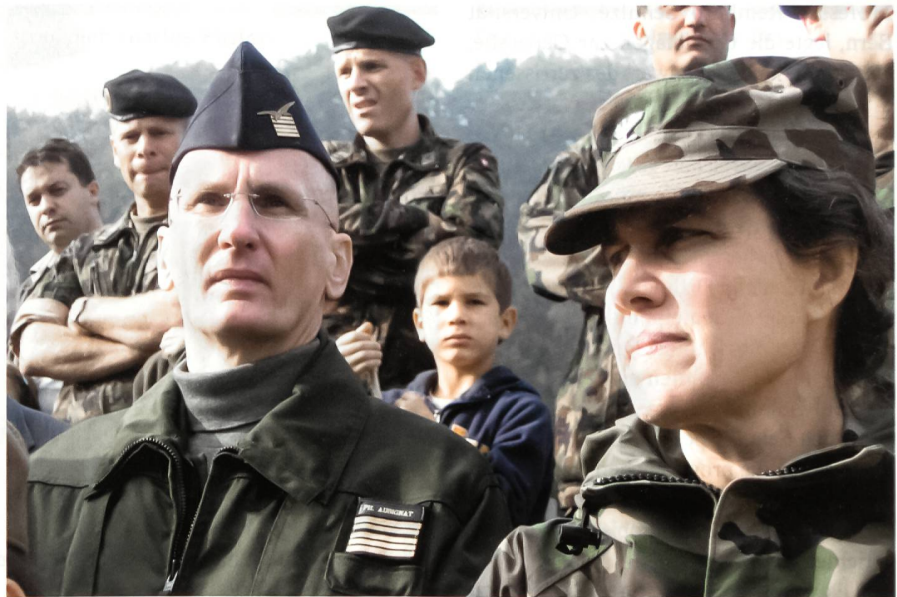
Attachés aus Frankreich und den Vereinigten Staaten in der Übung RHEINTAL 06.

Für den Bundesrat sind mehrere Elemente zentral. Als wichtigen Grund nennt er die Krisenresistenz: «Die Akkreditierung gewährleistet jederzeit den institutionalisierten Zugang zu den Sicherheitsinstitutionen, namentlich zum Verteidigungsministerium und zu den Streitkräften des Gastlandes. Damit ist die Krisenresistenz