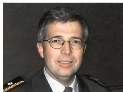
Brigadier Erwin Dahinden.

C-802-Rakete iranischer Herkunft. Der Volltreffer auf die Hanit belegt, dass auch Guerilla-Kräfte moderne Boden-See-Geschosse ins Treffen führen können.