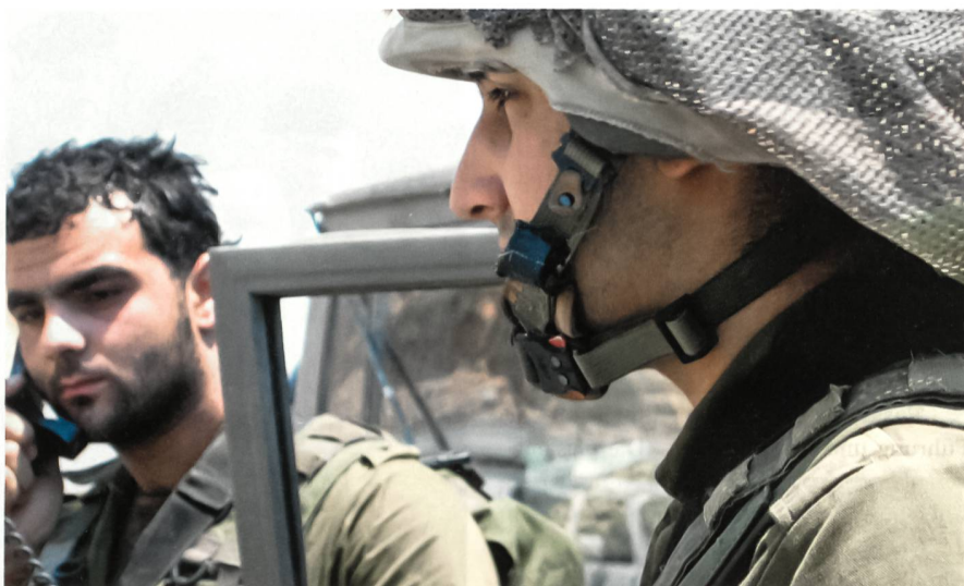
19. Juli 2006, Beginn der israelischen Bodenoffensive: Kämpfer an der Front.

Der Krieg begann am 12. Juli 2006 um 9.05 Uhr mit der Entführung zweier israelischer Soldaten an der Grenze bei der Ort-