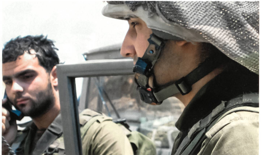
19. Juli 2006, Beginn der israelischen Bodenoffensive: Kämpfer an der Front.

Der Krieg begann am 12. Juli 2006 um 9.05 Uhr mit der Entführung zweier israelischer Soldaten an der Grenze bei der Ort-