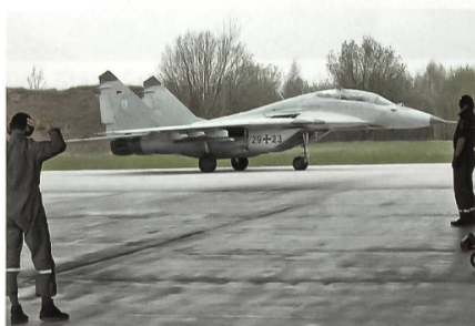
Letzte MiG-29 der Bundeswehr.