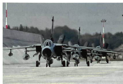
Tornados rollen zum Start.

ten, reaktionsfähigen sowie durchhaltefähigen und mobilen Fähigkeiten.