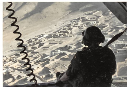
Im Einsatz über Afghanistan.