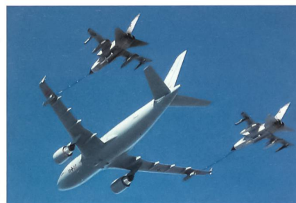
Luftbetankung – hohe Schule.