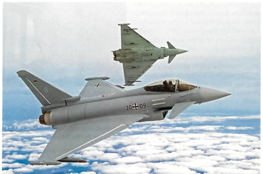
Zwei Eurofighter der deutschen Luftwaffe.

Die «Vernetzte Operationsführung» (NetOpFü) spielt dabei eine Schlüsselrolle. Sie ist das Führungs- und Organisationsprinzip für die Bundeswehr und damit auch für die deutsche Luftwaffe. Sie ist Basis für die Ausgestaltung ihrer Fähigkeiten. Zielsetzung von NetOpFü ist es, In-