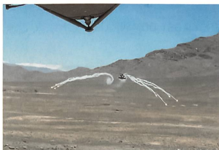
Täuschkörper über Afghanistan.