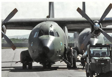
Transall in Termez, Usbekistan.