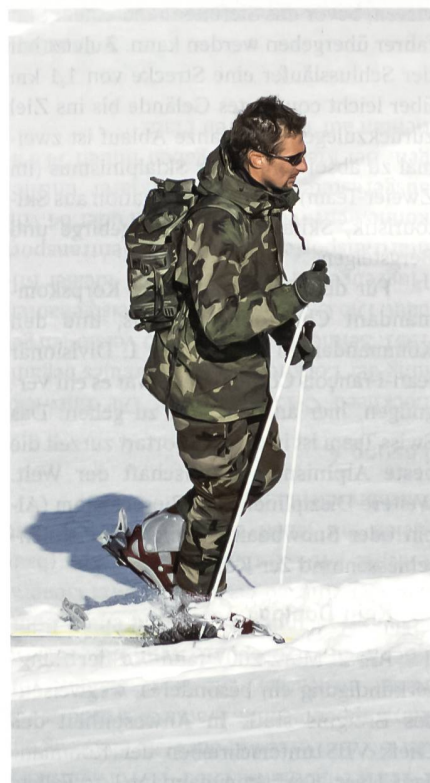
Im Kampfanzug bergan.