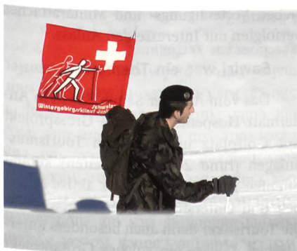
Die Fahne gehört dazu.