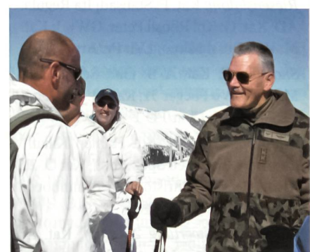
Der Chef der Armee im Element.