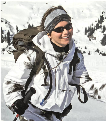
Charmant trotz Anstrengung.