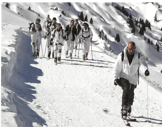
Zum 45. Mal: Der Winter-Gebirgslauf Lenk.

Der happe Aufstieg führte über Bire, Rühlisenpass, Parwengenkessel zum Rinderbergspitz auf 2078 m ü.M. und eine Distanz von rund 6 Kilometern. Anschliessend erfolgte bei teilweise dichtem Nebel die Abfahrt über mehrheitlich Kunstschnepisten hinunter zum Ziel bei der Talstation der Rinderbergbahn in Zweisimmen (940 m ü.M.), über 6,5 km.