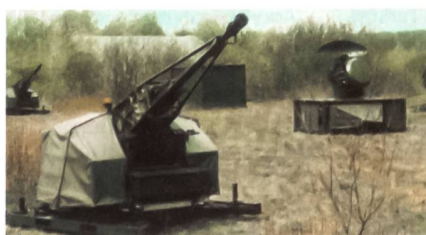
Oerlikon Contraves Skyshield.

Der Rüstungskonzern Lockheed Martin hat das Fliegerabwehrsystem Skyshield 35 mm AHEAD (Advanced Hit Efficiency And Destruction) des Herstellers Oerlikon Contra-