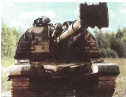
2S19SP mit Kanone im NATO-Kaliber 155 mm.

Um weitere Kunden auf dem Exportmarkt hinzugewinnen zu können, wurde kürzlich eine neue Version der Panzerhaubitze 2S19 SP mit einer Bewaffnung im NATO-Kaliber 155 mm vorgestellt. Die neue 155-mm-Ka-