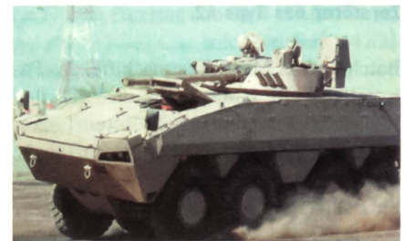
AMV mit BMP-3-Turm.

Die Vereinigten Arabischen Emirate erwägen den Kauf gepanzelter Radfahrzeuge des Typs AMV 8x8 des finnischen Herstellers Patria,