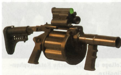
Rippel XRLG 40.

Konventionelle Geschosse mit einer Mündungsgeschwindigkeit von 76 m/s können bis zu 400 m verschossen werden,