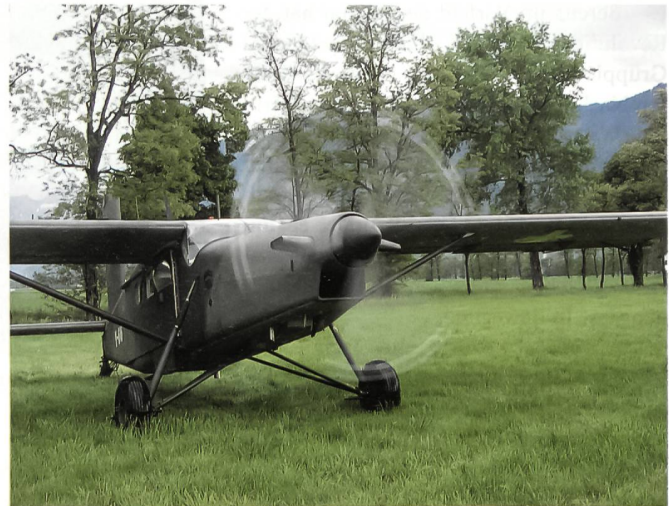
Noch dreht der Propeller.