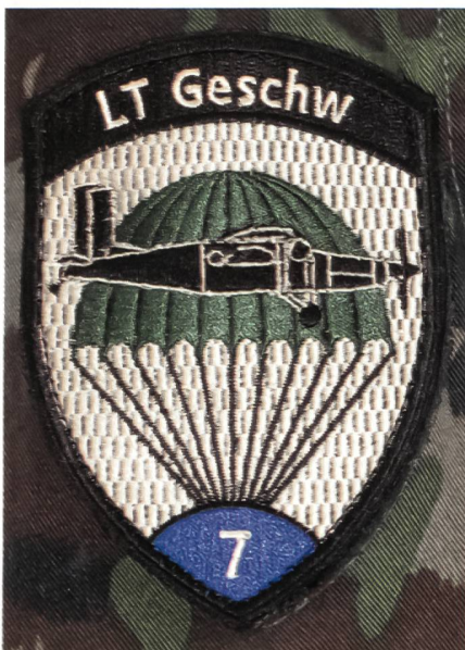
Badge LT Geschw 7.