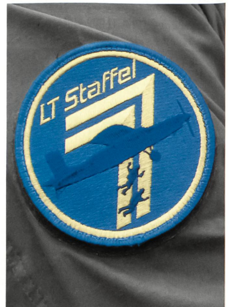
Badge LT Staffel 7.