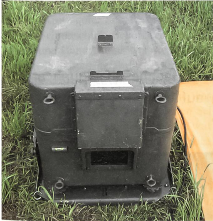
Gerät zur Einweisung.