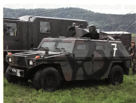
Sicherheit ist gewährleistet.