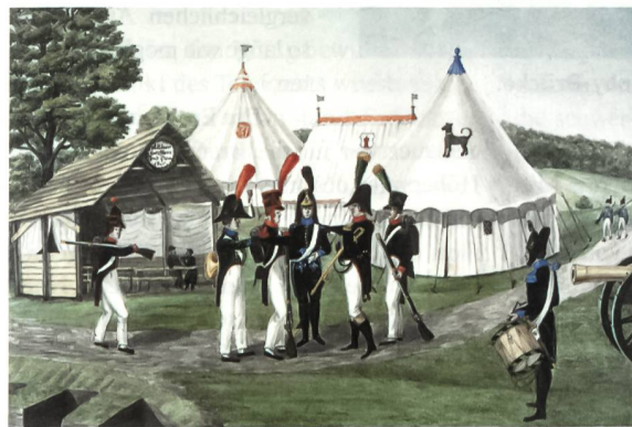
Lagerszene mit Schaffhauser Milizen von H. W. Harder (1810–1872), Museum zu Allerheiligen, Schaffhausen.

Die politische und militärische Lage war um 1800, unmittelbar nach der Besetzung der Schweiz durch Napoleons Frankreich (1798), alles andere als leicht und rosig. Auch im Kanton Schaffhausen war die Lage nach dem Zusammenbruch von 1798 schwierig und unsicher. Schaffhausen war zum Schlachtfeld französischer, österreichischer und russischer Truppen geworden.