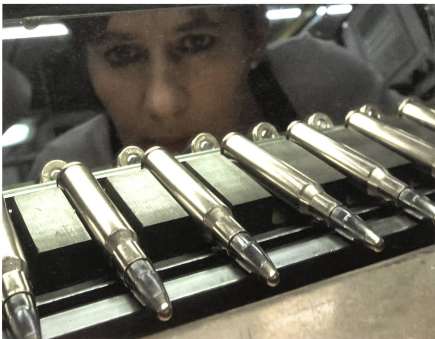
Optische Qualitätskontrolle während der Herstellung von qualitativ hochstehender Kleinkalibermunition bei der RUAG.

Dieser Umstand erfordert von den Verantwortlichen der RUAG viel Flexibilität und Können, weil ihre Handlungsfreiheit eingeschränkt ist. Auf der anderen Seite muss der Besitzer der RUAG auch dafür