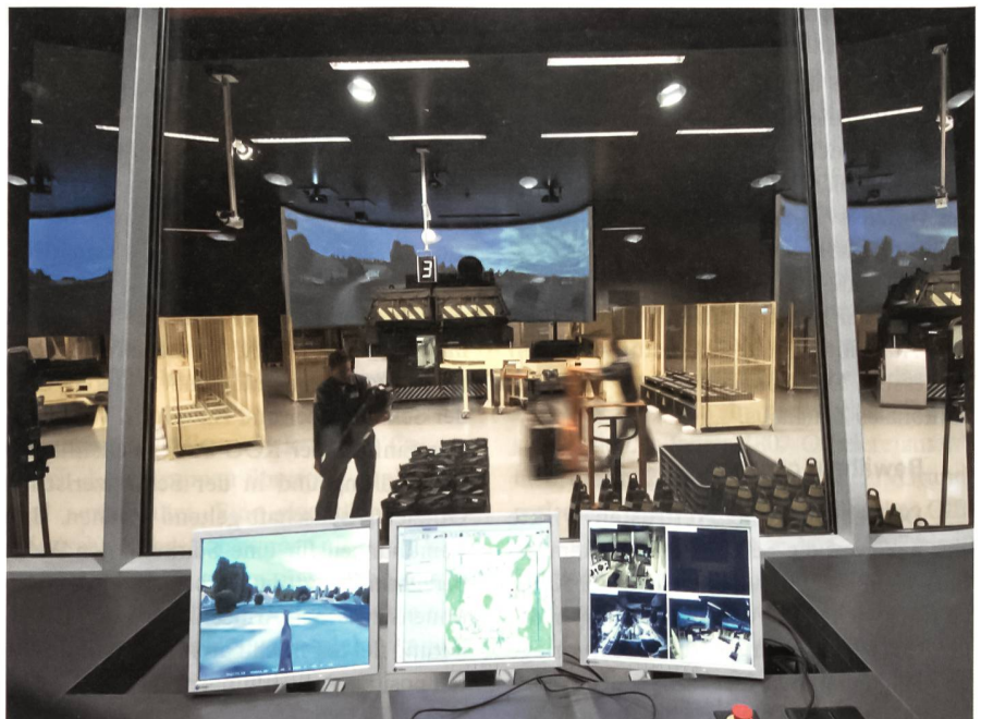
Der Simulator für die Schiessausbildung der Panzerhaubitze M109 erlaubt ein realitätsnahes und umweltfreundliches Training.

Der Bundesrat erwartet, dass die RUAG im zivilen und militärischen Bereich konkurrenzfähig bleibt und ihre Marktleistungen zur breiteren Abstützung der Technologiefelder ausbaut und stärkt. Für die Tätigkeiten zugunsten unserer Armee sollen jene Technologiegebiete gefördert werden, die von den Armeepianern als Kernbereiche festgelegt oder für die Sicherstellung der Betriebsfähigkeit der in der Armee