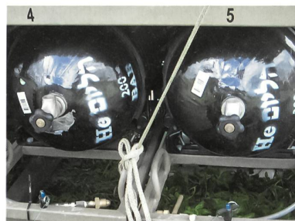
Heliumflaschen für den Fesselballon: Erkennbar die hebräische Aufschrift.

Fortschritte erzielte die Armee seit 2004 auch im Aufbau der ISTAR-Fähigkeiten. Die konzeptionellen Grundlagen sind erstellt und im Grundsatz gutgeheissen. Mit hin wird nun mit der Umsetzung begonnen. Die besondere Stärke des Feldversuchs ROVER war doppelt abgestützt: