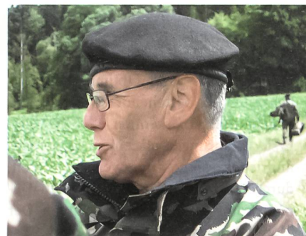
Div Fred Heer, Stv Kdt des Heeres: «Solche Feldversuche müssen sein.»