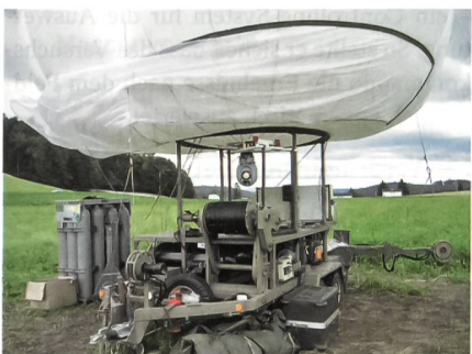
Der israelische Fesselballon am Boden bei der Ortschaft Ersigen.