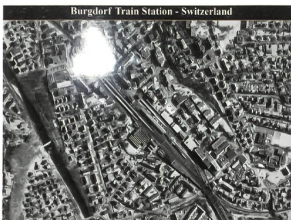
Bild vom Satelliten EROS B: 15. März 2007, Bahnhof Burgdorf und Umgebung.