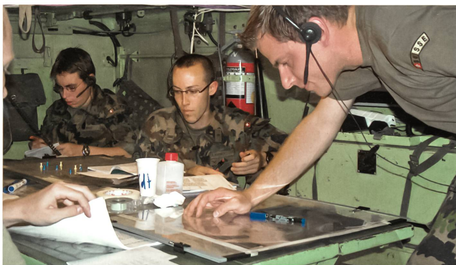
Angehende Offiziere von Bat Stäben trainieren den Entscheidungsprozess.

Nur mit gutem Teamwork kann eine Operation erfolgreich geführt werden. Kein