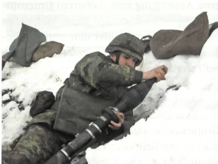
Ausbildung mit der Panzerfaust.