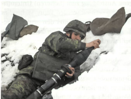
Ausbildung mit der Panzerfaust.