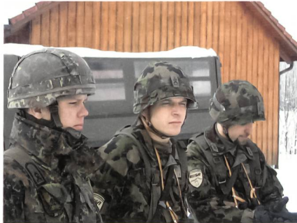
Klasse 2 in Neuchlen-Anschwilen.