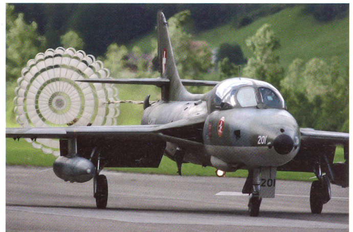
Hunter mit Bremsfallschirm.