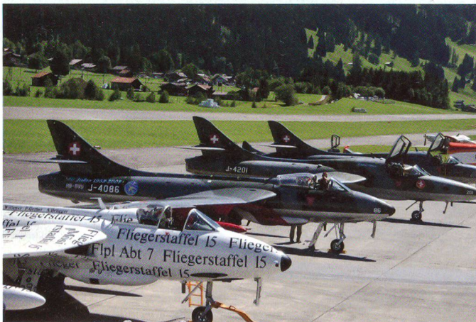
Nostalgie – die Hunter-Linie.