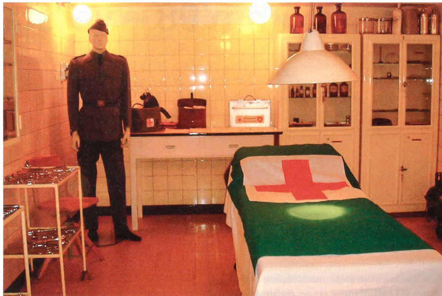
Sanitätsdienst in der Festung: ein Operationsaal.

Hier sei aber betont, dass FORT – CH / Festungen – Schweiz nicht Eigentümer der Festungsanlagen ist. Die Anerkennung für die Leistungen zur Rettung dieser wichtigen historischen Substanz gebührt den