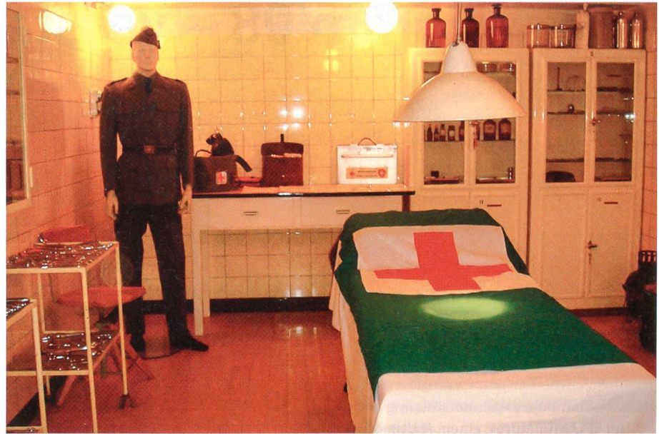
Sanitätsdienst in der Festung: ein Operationsaal.

Hier sei aber betont, dass FORT – CH / Festungen – Schweiz nicht Eigentümer der Festungsanlagen ist. Die Anerkennung für die Leistungen zur Rettung dieser wichtigen historischen Substanz gebührt den