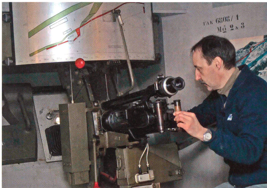
Grosser Wert wird auf die Pflege der Waffen gelegt – auch in alten Festungen.

Unter der Geheimhaltung entstand sogar im Verlaufe der Zeit ein eigentlicher Festungsmythos, der sich im Bild des wehrhaften Igels bildhaft manifestiert, der die unterirdischen Anlagen in der Phantasie,