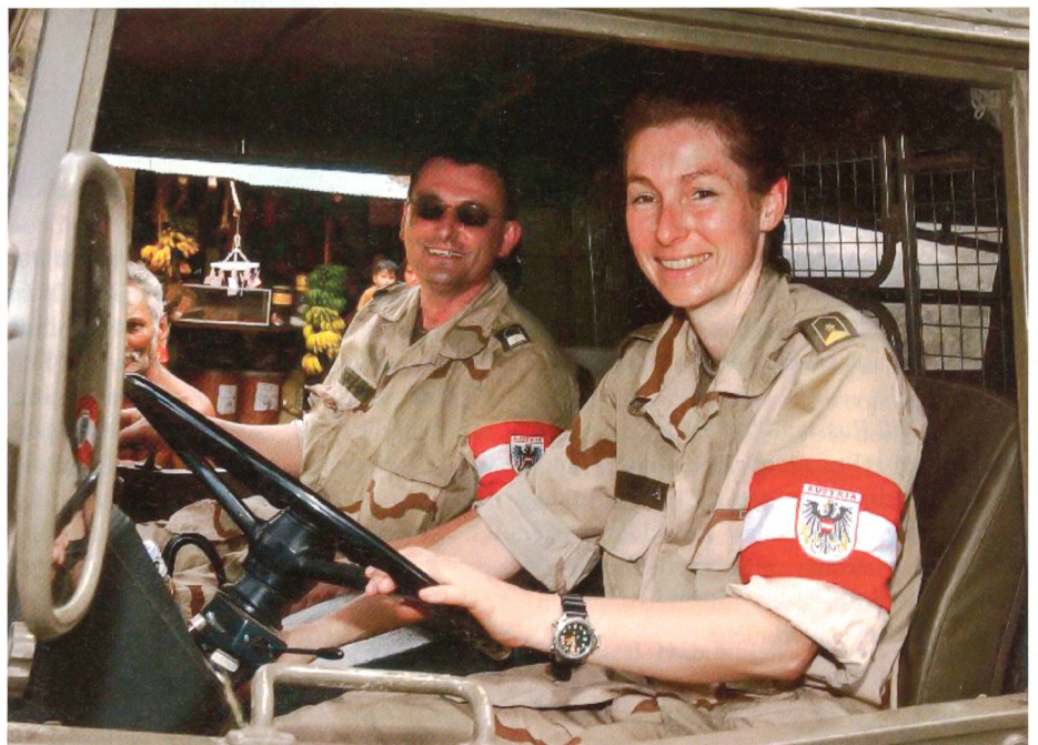
Gut gelaunt am Steuer.

weibliche Offiziere als Truppenoffiziere verwendet. Neun Berufsoffiziersanwärterinnen besuchten den Fachhochschul-Diplomstudienlehrgang «Militärische Füh-