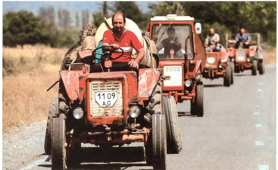
Georgische Bauern auf der Flucht.

Das atlantische Bündnis, allen voran die USA, setzte sich über die diesbezüglichen