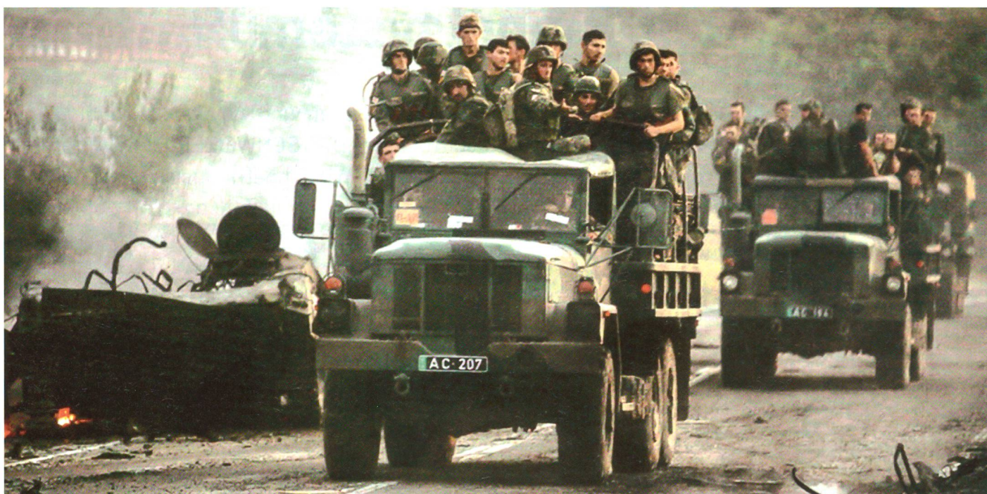
Georgische Soldaten auf dem Rückzug.