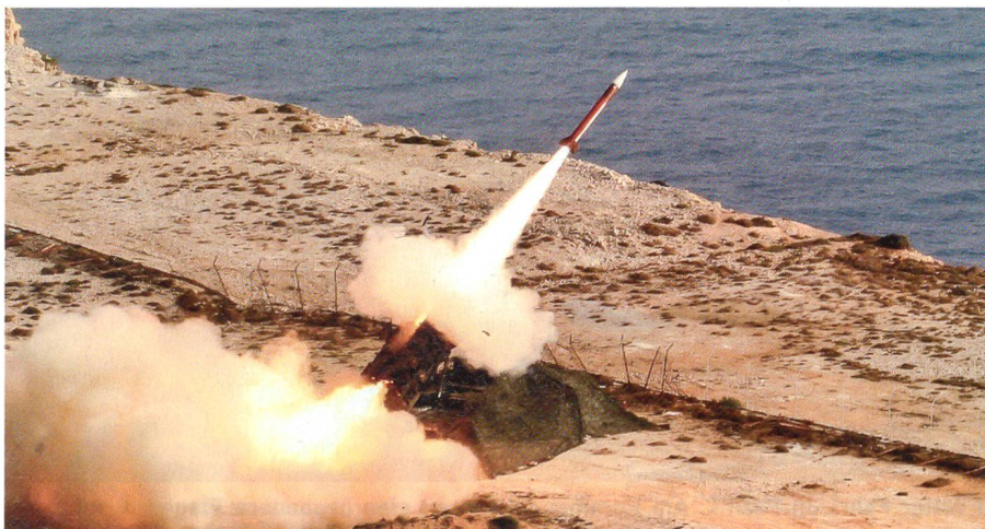
Abschuss einer deutschen Patriot-Pac-2-Rakete, fotografisch genau «erwischt».

Das nebenstehende Bilddokument erinnert an die Schiessübung «OPEN SPIRIT», die ein Schweizer Flab-Detachement zusammen mit der deutschen Bundeswehr auf der Insel Kreta bestand.