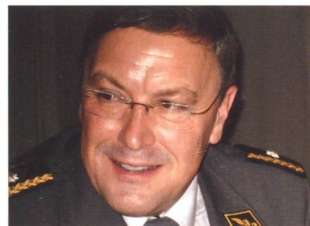
Brigadier Urs Hürlimann nahm als gebürtiger Zuger am Schwyzer Anlass teil.

zulehnen: «Webers Vorstoss lässt keine glaubwürdigen Übungen in der Schweiz mehr zu und gefährdet direkt die Souveränität und Neutralität der Schweiz.»