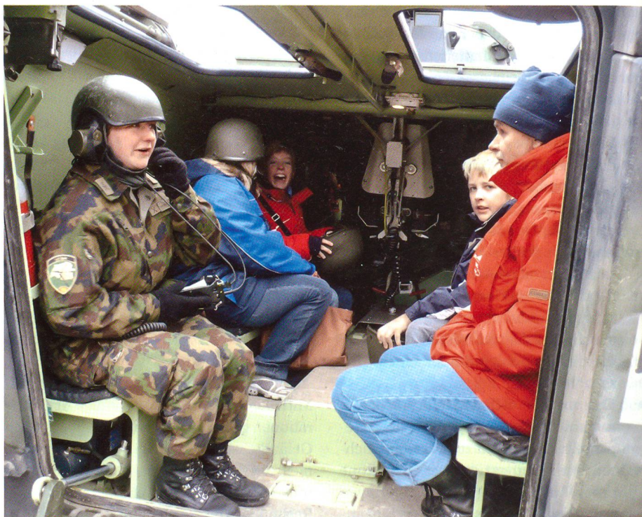
«Rampe frei, Rampe hoch!»: Der Radschützenpanzer ist gut gefüllt. Das etwas andere Taxi löst bei den Gästen gute Stimmung aus.

Grossen Anklang fanden die Vorführungen Zugschule – in welche Zivilistinnen miteingebunden und mit einer roten Rose beschenkt wurden –, das Errichten eines mobilen Checkpoints, PAL-Simulationsschiessen oder das Sofortaktionstechnik-Schiessen in den KD-Boxen. Beliebt waren aber auch die Posten, bei denen die Besucher mitmachen konnten: Unter anderem das Panzertaxi-Mitfahren, das Simulations-