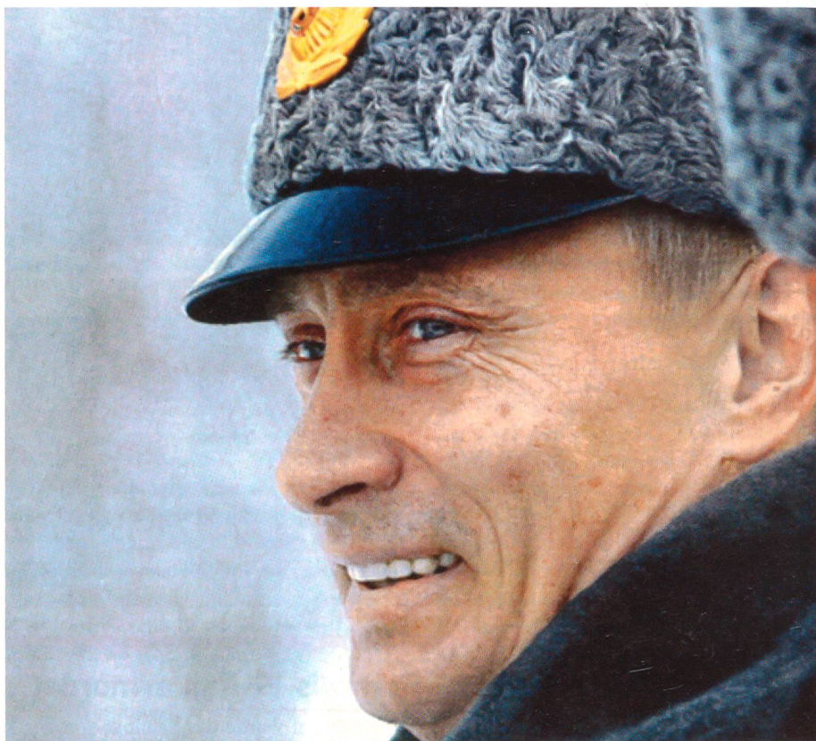
Der russische Staatschef Putin.

Diese Abmachungen, von denen man bis Mitte der 80er Jahre nur träumen konnte, sind in die Tat umgesetzt worden. Das, und das allein, rechtfertigte die seither